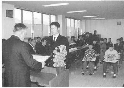
表彰を受けられた皆さん

のあった方、また、他の青少年活動の模範となる行いをした方に贈られる青少年活動表彰