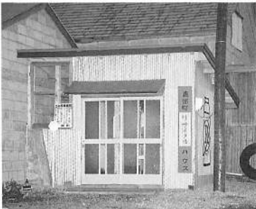
新しく設置された「リサイクルハウス」

ック・ダンボール等を回収し、リサイクル活用品として専門業者に売却し、益金は学校などに寄付されております。