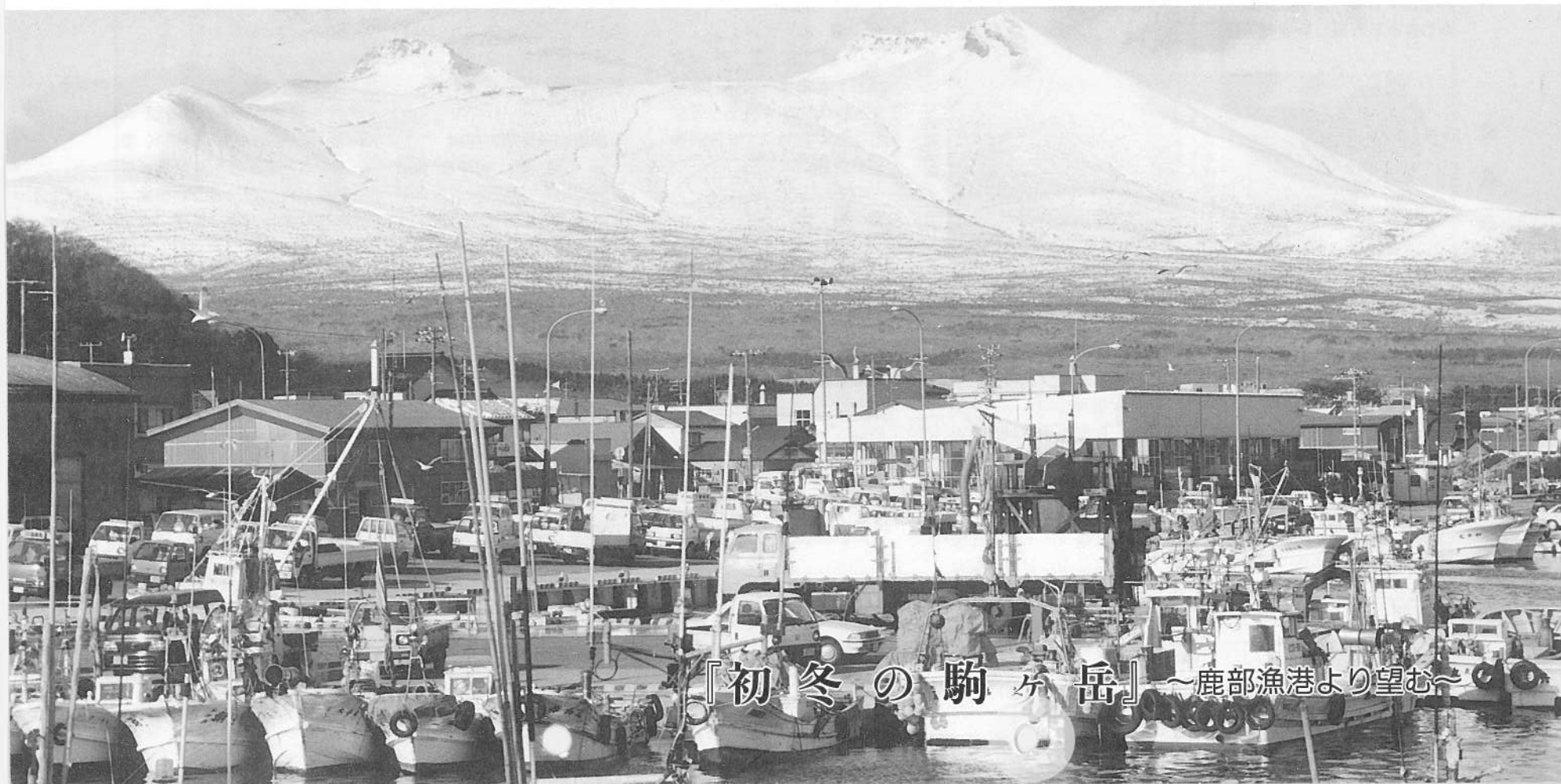
『初冬の駒ヶ岳』～鹿部漁港より望む～