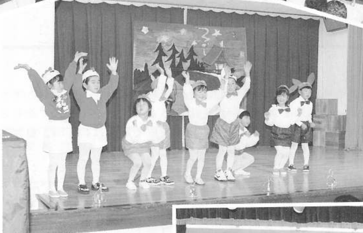
音楽隊はプレーメンへ