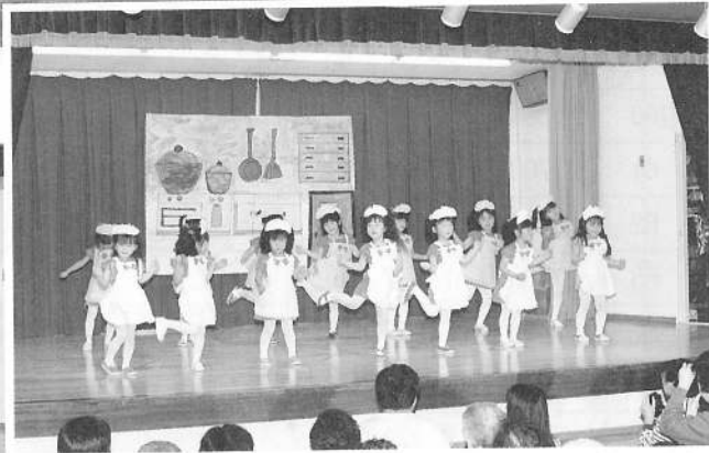
ロックンロールお母さん