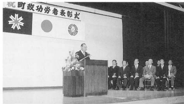
町政功労者表彰式