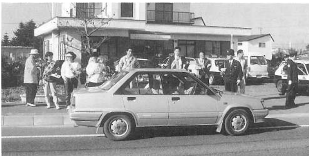
ドライバーの皆さん安全運転をお願いします

10/28 交通安全推進協議会・ 安全運転管理者・婦人会 の皆さん「交通安全」に 一役。