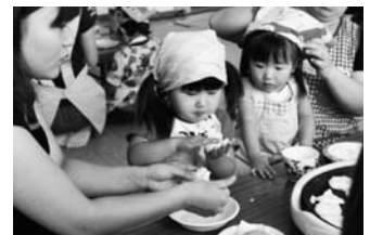
芋もち上手にできたかな～?

9月15日(木)バンビ教室収穫祭が行われました。バンビ農園で育てたじゃがいもやにんじんを子ども達とお母さんと収穫し、たくさん取れたじゃがいもは芋もちにしたり、ポトフに加えたりして食べました。そこで今回作った料理のレシピを紹介します。「ミルクカレーポトフ」は、野菜の他に肉や魚なども一度に食べられ具たくさんなので、時間のない朝ごはんにも最適な一品料理です。カレー粉の香りが牛乳のにおいを消してくれるので、牛乳が苦手な人も食べやすいスープになっています。日本人に不足しがちなカルシウムや食物繊維をたっぷりとることができ、さらに、カレー粉などの香辛料を効かせることで、塩分も控えめに仕上げることができます。ぜひご家庭で試してみてください。