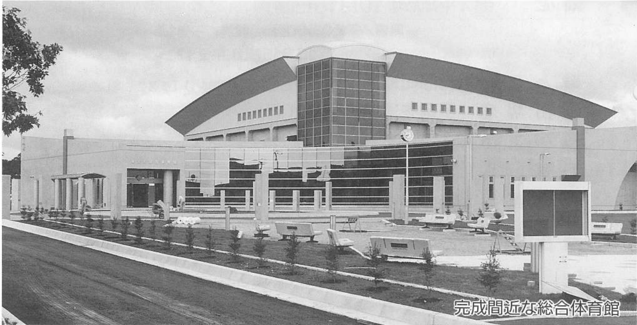
完成間近な総合体育館