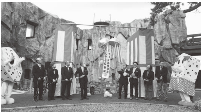
しかべ間歇泉北海道遺産選定記念セミナー

平成三十年十一月一日、大正十三年の発見から、これまで、地域で守り育ててきた、「しかべ間歇泉」が見事、第六十三号