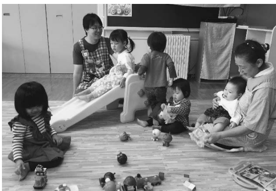
しかべ保育事業「ひよこ」

次に四つ目の保育体制でござ います。課題でありました〇 歳から二歳までを対象とした保 育体制に参りましたが、町の独 自事業という枠組みで平成三十 年十月一日から開始し、切れ目 のない保育体制を構築すること ができました。鹿部町らしい 子育て支援の更なる充実に向け 今後も改善を重ねて参ります。