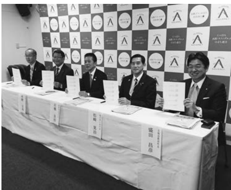
「にっぽんA級グルメのまち連合」設立調印式

この新たな支援体制を活用し 公共施設の建て替えや道の駅運 営等と併せ、より経済波及効果 の大きい事業計画を作成し、温