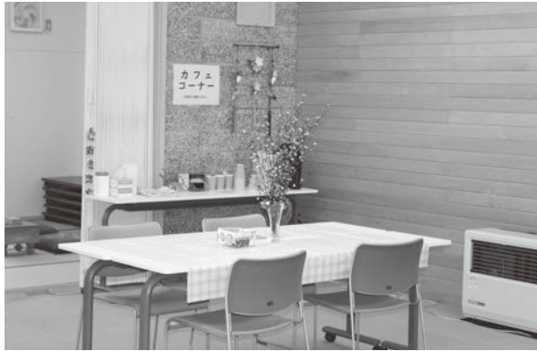
「鹿部町コミュニティカフェ」(宮浜児童館)

間伐材なども含めました再生可能エネルギーの利活用に取り組みます。このほか、平成三十年度の大きな目玉政策であり、循環型地域経済の確立に向けた中小企業チャレンジ支援事業補助金の創設、漁場造成の拡大、漁業分野の人材育成事業、幼稚園の夏休み冬休みの預かり保育の本格実施、幼小中の教材完全無料化、英語検定受験料の助成、各世代が集う交流の場「コミュニティカフェ」のプレオープン。