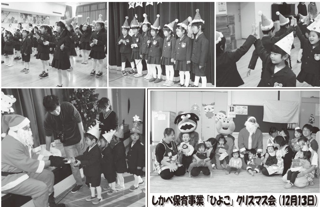
しかべ保育事業「ひよこ」クリスマス会 (12月13日)