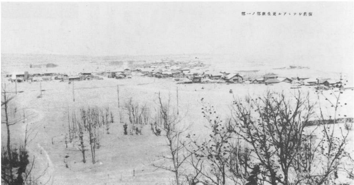
鹿部市街の噴火一年後の様子