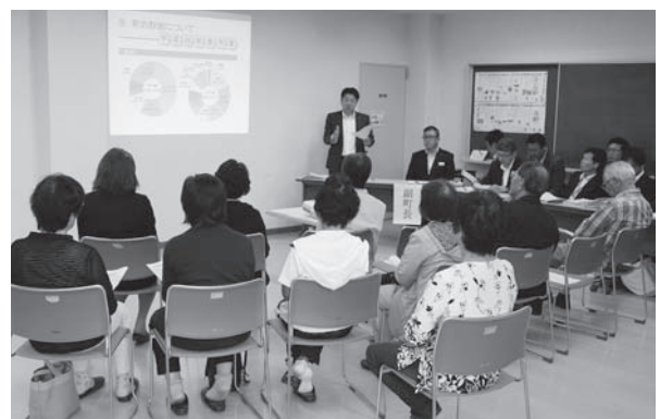
「対話ミーティング」

どちらも、今後とも継続して参 りたいと考えておるところでござ いますし、役場と本別中央会館に は、意見・提案箱も設置し、町民 皆さまの小さな気づきや想いを大 切に、「心豊かな笑顔あふれ光り 輝く町」を目指して参ります。