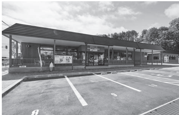
「道の駅しかべ間歌泉公園」

大変貴重な間歌泉をメインに「足湯」、「浜のかあさん食堂」、「温泉蒸し処」、特産品販売の「食とうまいもの館」など、本町の魅力が存分につまった観光拠点としておかげさまで、既に、六十万人を超える入場者があり、予想を上回る賑わいぶりに関係者、関係機関はもとより、町民の皆さまに感謝を申し上げます。