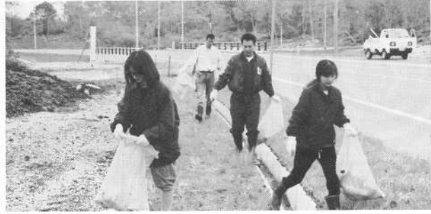
道々大沼公園鹿部線沿いの空き缶拾い奉仕活動