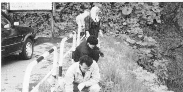
商工会婦人部の皆さん