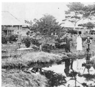
温泉病院 亀ノ湯 (大正期)