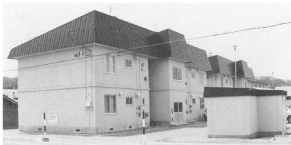
鹿部川団地 3,420万円借入

簡易保険・郵便 年金積立金で 豊かなまちづくり 平成三年度、簡易保険・郵便年金積立金の融資を受け公営住宅の建設事業を実施しました。 簡易保険・郵便年金は、個人の病気やケガ等の万一の保障や将来の生活保障だけでなく、私たちの明るく住みよいまちづくりに大きく貢献しており、社会生活に欠かせない重要な役割を果たしております。