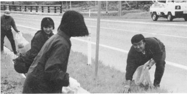
全国拳闘クラブ鹿部ブロックの皆さん