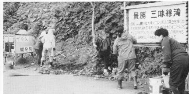
三味線滝周辺の清掃奉仕活動