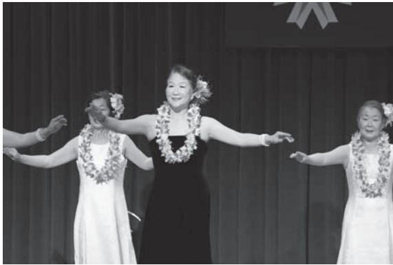
ケアラフラサークル