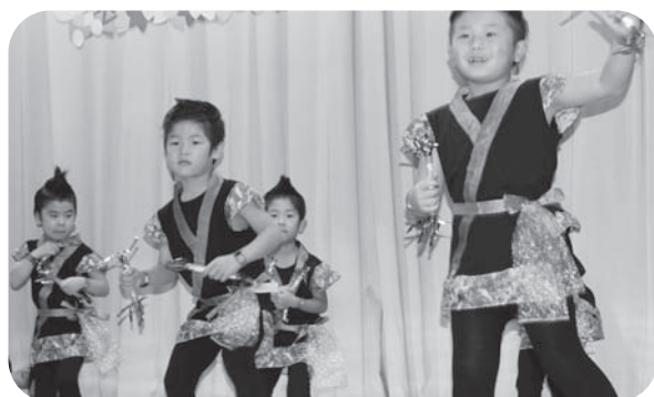
うさぎ組さん男の子による力強い遊戯「KAGUYA」。