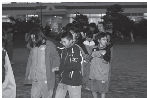
フォークダンスでは、男子・女子仲良く踊っていました。