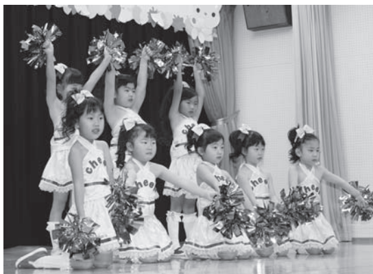
うさぎ組さん女の子はチアダンスを元気いっぱい踊りました！