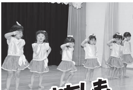
もも組さん女の子はかわいい踊りで会場のみんなを魅了！