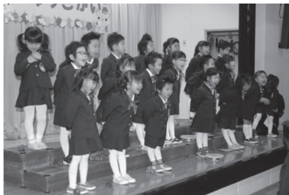
さくら組さんは歌と口奏も発表しました！