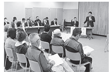
第1回対話ミーティングの様子

※お仕事などにより平日の対話ミーティングに参加できない方は、12月17日（日）に開催する対話ミーティングにご参加ください。