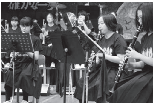
吹奏楽部による演奏が会場を盛り上げます!