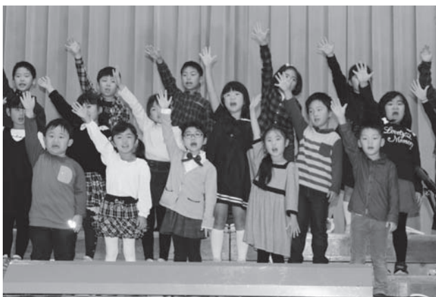
1年生の合唱。元気いっぱいの歌声をとどけました!

平成29年10月27日(金)、鹿部小学校では、学芸会を開催しました。今年度は「みんなが心をひとつにして笑顔と感動を届けよう」をスローガンとし、劇や合唱、器楽合奏を発表しました。