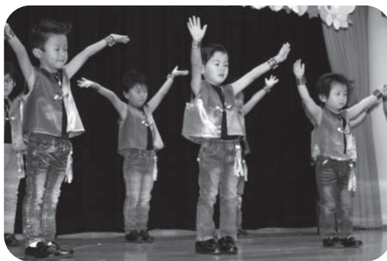
さくら組さん男の子の「Summer Madness」。かっこよくキメました☆