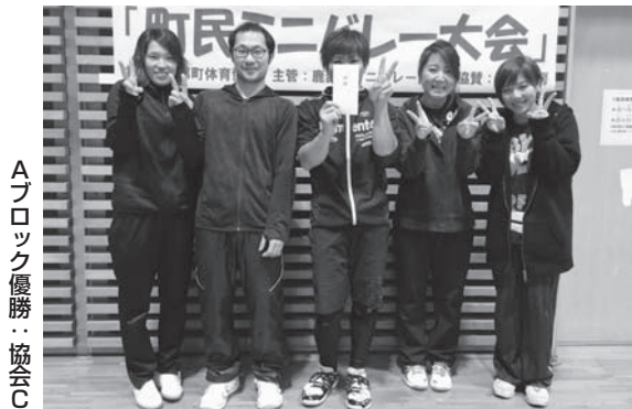
Aブロック優勝：協会C