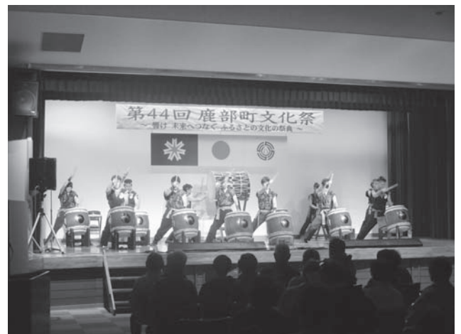
特別出演 函館巴太鼓振興会 (文化協会招致事業)