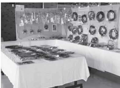
鹿部町地域活動支援センターぽっぽ