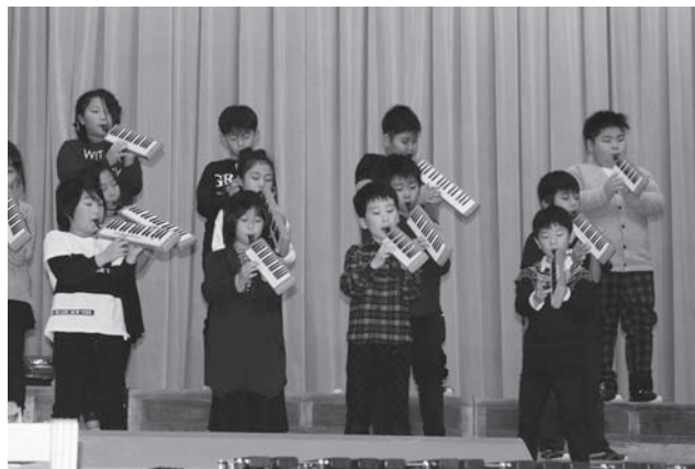
3年生の合奏「サザエさん」と「風の谷のナウシカ」。みごとな演奏を披露してくれました!