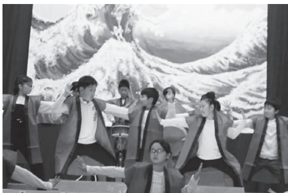
5年生合奏「まつり」では気合の入ったかけ声と荒々しい波を表現!