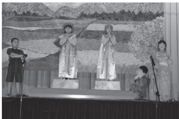
名演! 2年生の劇「おきたじぞうとねむたじぞう」。

また、中学生による合唱の発表も行われました。校内では、児童がこれまでに制作した絵画を展示する作品展も同時開催され、来場された皆さんの目を引き付けていました。