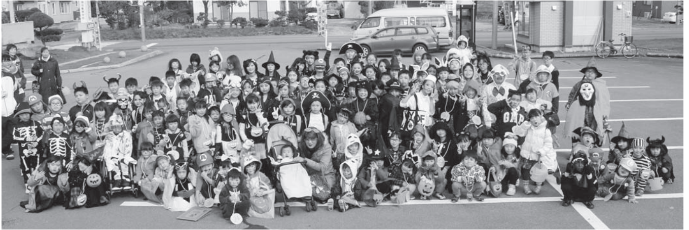
みんなで記念撮影☆