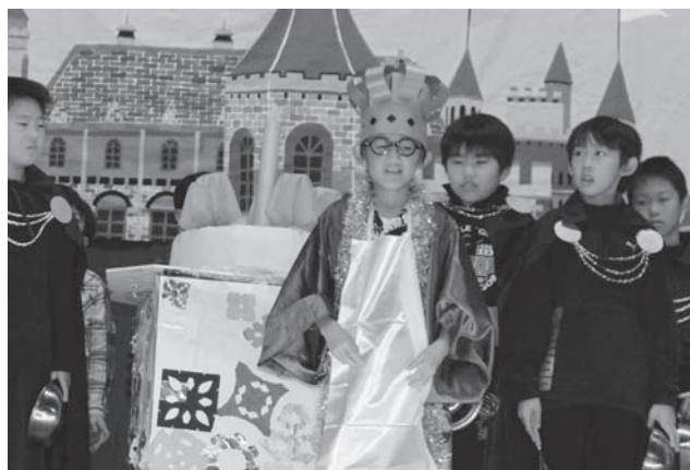
衣装もばっちり! 4年生の劇「変そう! 王様フィーバー」。