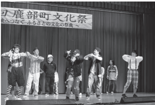
Crazy Beat Crew