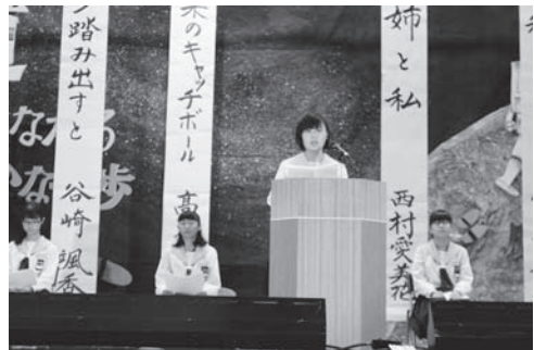
それぞれの思いをぶつけた私の主張コンクール