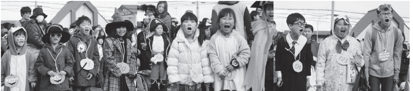
今年は仮装コンテストも開催！アピールポイントは仮装！元気！雰囲気！