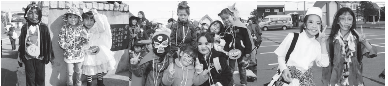
工夫を凝らした衣装・メイクでばっちり仮装！