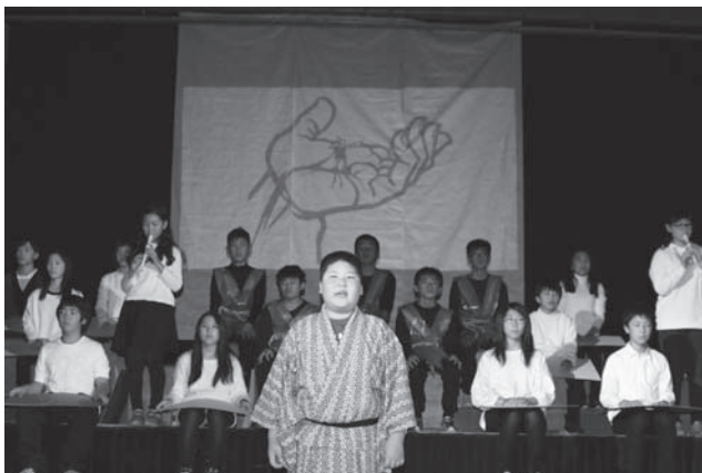
6年生の劇「シュプレヒコール劇 八郎」。本格的な劇で観客を引きつけました。