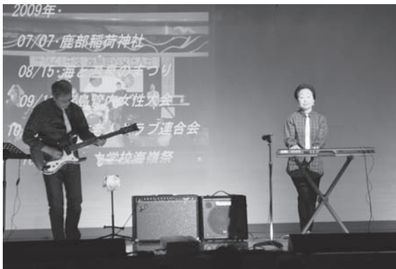
軽音楽サークル音音