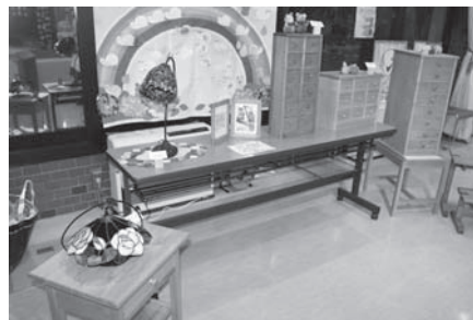
ご近所コラボ (家具・ステンドグラス)