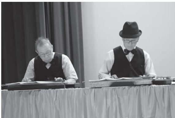
大正琴サークル「すけそうの会」