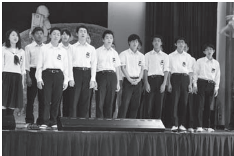
毎年恒例の合唱コンクール

平成29年9月30日(土)、鹿部中学校では、学校祭「海嶺祭」を開催しました。今年度は「道く未来へつながる確かな一歩」をテーマに掲げ、私の主張コンクールや合唱コンクール、吹奏楽部演奏、実行委員会が企画したステージ発表などを行いました。テーマどおり、生徒一人一人が協力しあい、成し遂げるための一歩の大きさを感ずることのできた一日になりました。