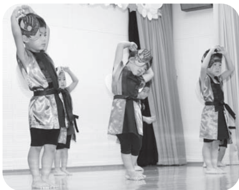
もも組さん男の子はキュウレンジャーになりきって「キュウタマ首頭」を披露。