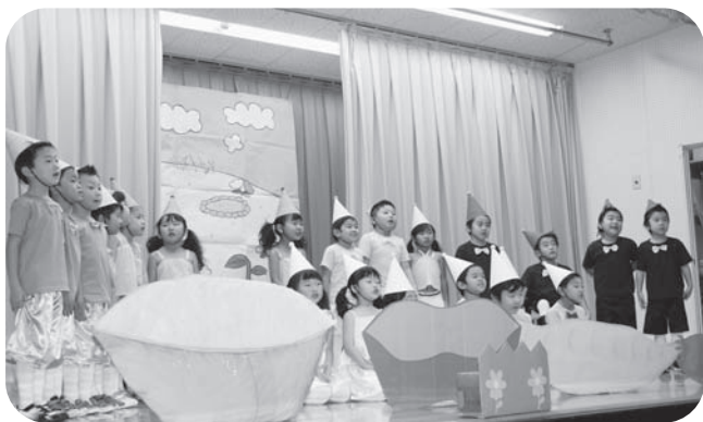
うさぎ組さんは劇「そらまめくんのベッド」を好演しました。

園児たちの元気な歌や劇、楽器演奏などは、来場された皆さんを魅了し、笑顔にしていました。