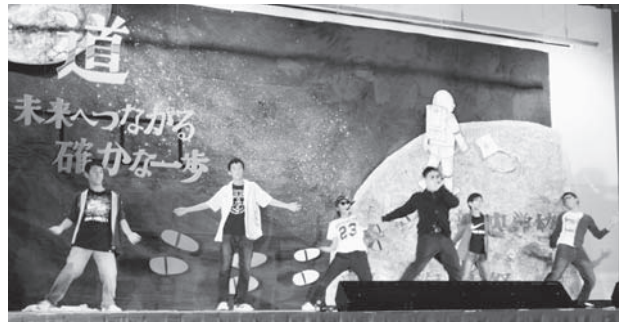
実行委員会のステージ発表で大盛り上がり!