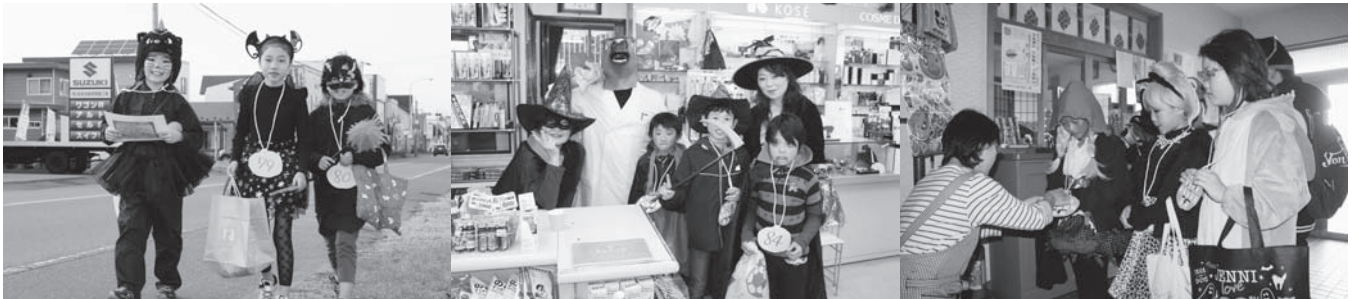
町内の事業所で「トリック・オア・トリート」