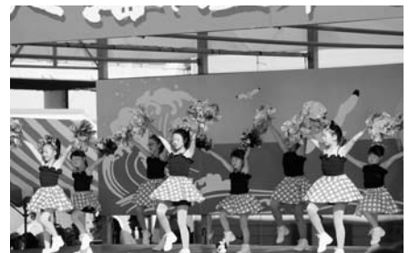
チアリーディングサークルAnge