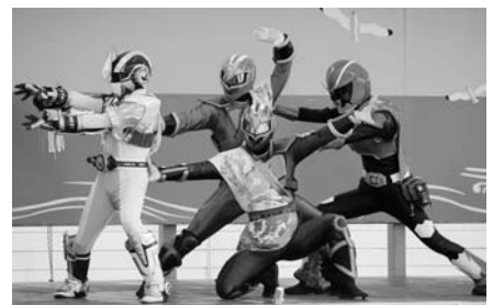
道産子ヒーローフェスin鹿部