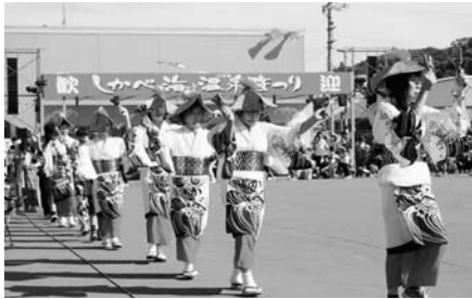
海と温泉のまつり音頭