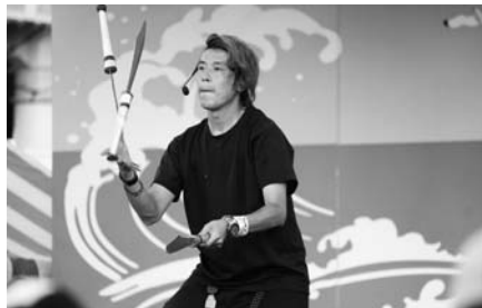
パフォーマーはち君ジャグリングショー