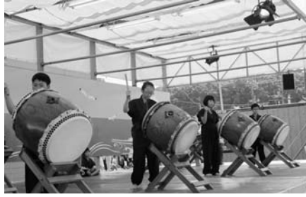
鹿部ジュニア太鼓披露