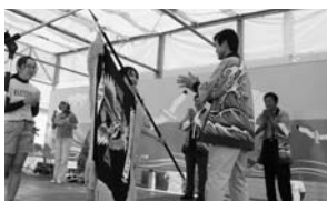
【女子の部優勝】 プリンセスタートルズ