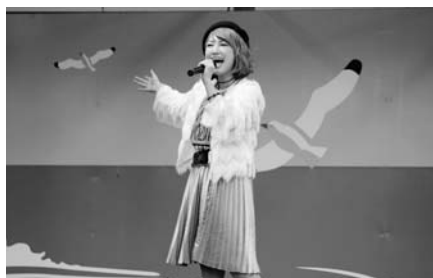
浅井未歩スペシャルライブ