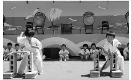
日本空手道大志会演武披露