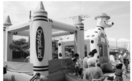
子供広場（ふわふわ）