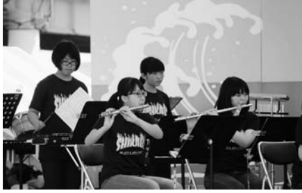
鹿部中学校吹奏楽部演奏披露