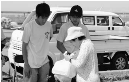
祭り会場の環境美化に協力していただいたボランティアスタッフ