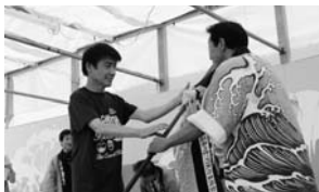
【男子の部優勝】 キューティーバニー

今年のカッター競漕は、男子の部14チーム、女子の部5チームが参加し、片道90mのコースで熱戦が繰り広げられました。選手たちのかけ声と見事なオールさばきに、会場からは大きな声援が送られていました。結果は次のとおりです。