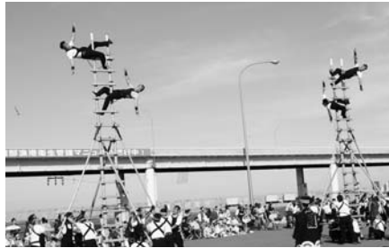
はしご乗り演技披露