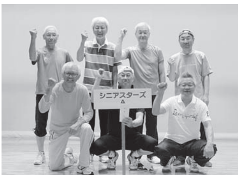
○シニアの部 【優勝】シニアスターズA 【準優勝】SNCチームA 【第3位】27区町内会Bチーム

平成29年7月14日(金)、総合体育館において、「第17回町民玉入れ大会」が開催され、幼児から大人まで全41チーム約280名が熱戦を繰り広げました。結果は次のとおりです。