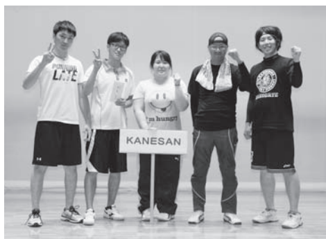
○一般の部 【優勝】KANESAN 【準優勝】なめこりトル中学生 【第3位】Li&Low