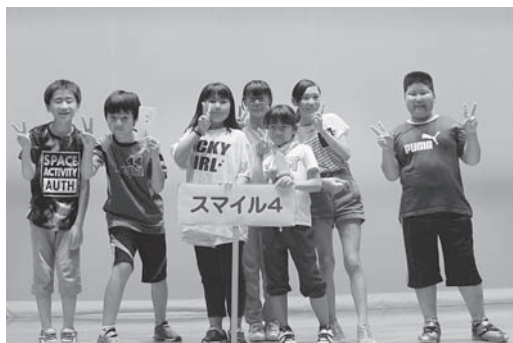
○ジュニアの部 【優勝】スマイル4 【準優勝】クラブプーズA 【第3位】陸上少年団A

平成29年7月14日(金)、総合体育館において、「第17回町民玉入れ大会」が開催され、幼児から大人まで全41チーム約280名が熱戦を繰り広げました。結果は次のとおりです。