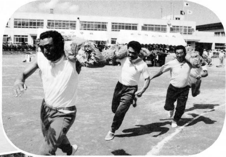
▲伝統俵かつぎリレー、100mはちょっとキツイかな