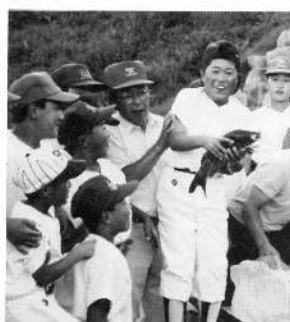
全道大会出場を記念して、 クラップーズ鹿部公園に コイ10匹寄贈

付がありました。 つなぐ親の会へ7千円の寄 るお礼として、鹿部町手 温泉のまつり宣伝用品によ 村鉄工所より、しかべ海と ○いすゞマリンショップ(南野 会へご寄付がありました。 がそれぞれ町社会福祉協 ティーとして 10万3千円 の合同ゴルフコンペチャリ ○道場水産と砂原町澤田水産 阿部 商店 2万円 鹿部漁協婦人部 2万円 店売り上げ金より ○しかべ海と温泉のまつり出 ら 3万円