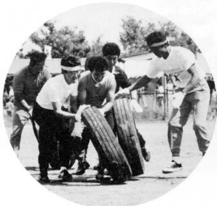
▲「安全運転は皆の願い」ですが 接触してますね～