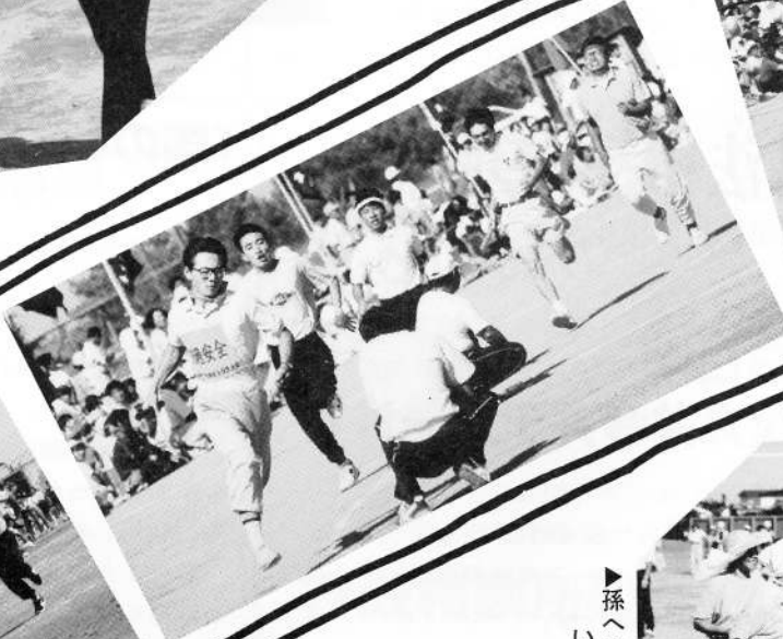
▶孫へのみやげ いっぱいですね