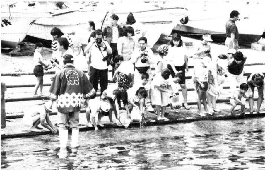
栽培センターの「ヒラメ稚魚放流」参加者は昨年の5倍以上でした