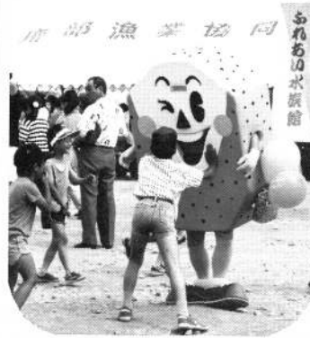
ふれあいの水族館