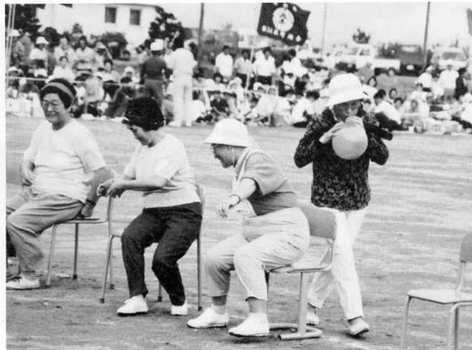
▲幸運の女神はオシリが大きい？