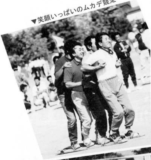
▼笑顔いっぱいのムカデ競走