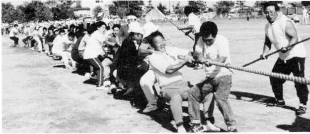
◀大岩白チームの つなひき