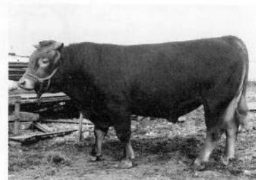
短角牛の導入 昭和47年

昭和一〇年要覧に馬一五三頭・豚五五頭・鶏四九羽とあります。牛の記録はありません。馬の頭数は運送や農耕のために当時は鱒の大漁時代でした。また出来潤の村有共同放牧場の記録に昭和二年、牛四頭とあります。昭和二十七年の要覧に馬 二二 牛 牝二 豚 九八 羊 一三 山羊 三三 兎 七七 鶏 五八〇