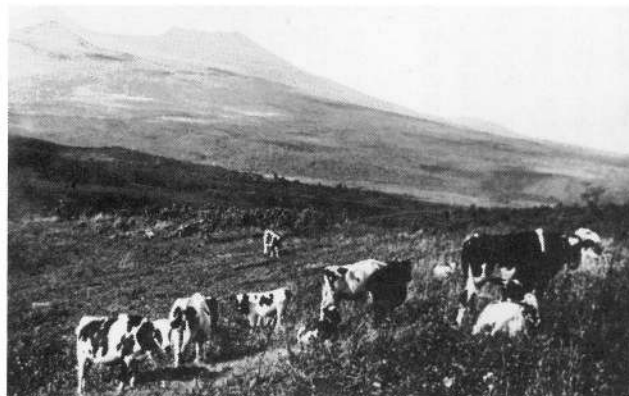
大正7年 雨鱒川牧場 道立文書館「町村誌」

昭和一〇年要覧に馬一五三頭・豚五五頭・鶏四九羽とあります。牛の記録はありません。馬の頭数は運送や農耕のために当時は鱒の大漁時代でした。また出来潤の村有共同放牧場の記録に昭和二年、牛四頭とあります。昭和二十七年の要覧に馬 二二 牛 牝二 豚 九八 羊 一三 山羊 三三 兎 七七 鶏 五八〇