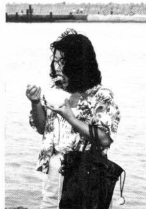
女と漁港とカジカ汁