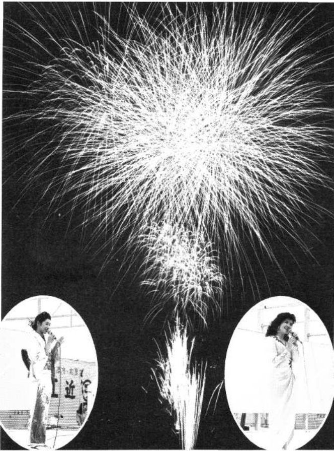
ピクチャーレコード 高田 友恵