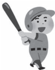
鹿部シニアスターズ