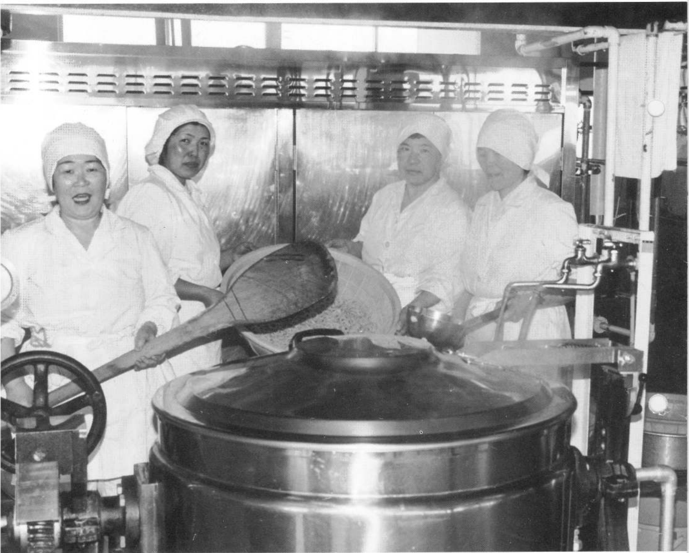
～鹿部町学校給食センター～