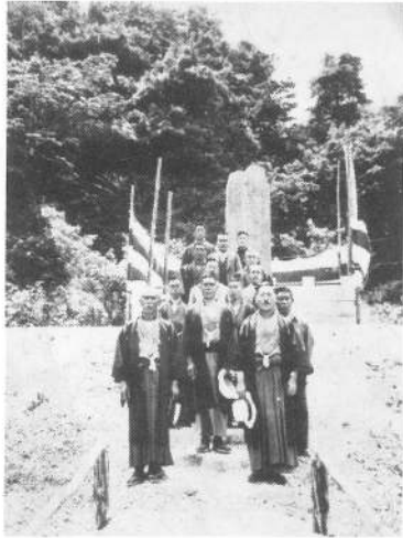
右 記念碑除幕式 上 電鉄の貨車で運ばれた投石用の石 中 村中総出で投石を船に積込む様子