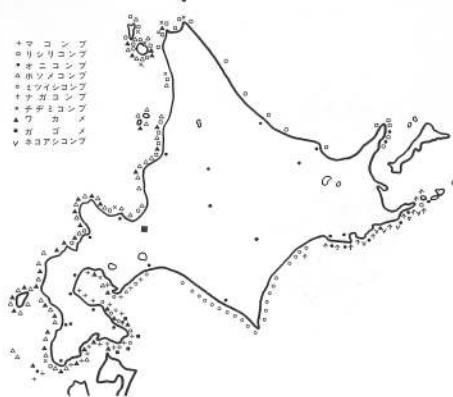
北海道沿岸産有用コンブ科植物分布図 (長谷川 1959) 『原色日本海産図鑑』

戦後、昭和廿五年ようやく自由経済となりましたが、道営の昆布検査はその後長くつづき、昭和五六年に漁協の民間検査に移りました。