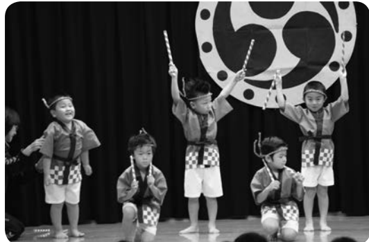
さくら組さん男の子はパチを持って力強く踊りました！