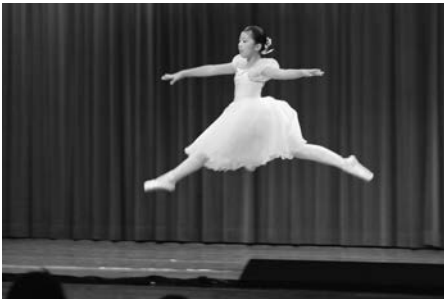
鹿部バレエサークル