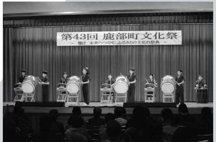
鹿部子供太鼓保存会