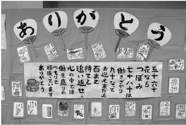
絵手紙サークル かもめ〜る