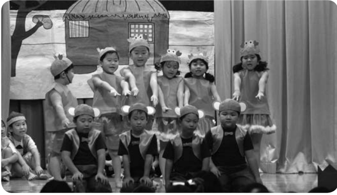
うさぎ組さんは劇「さるかにがっせん」を好演しました。

平成28年11月11日(金)、しかべ幼稚園では、「おゆづき会」が開催されました。園児たちの元気な歌や劇、器楽合奏などは、来場された皆さんを魅了し、笑顔にしていました。