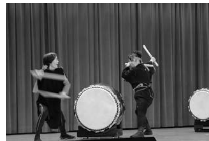
太鼓サークル 和響