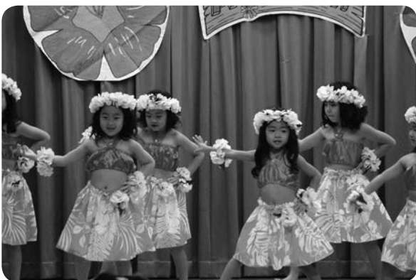
うさぎ組さん女の子はフラダンスで観客を魅了しました。