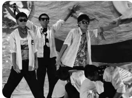
ステージ発表で大盛り上がり！