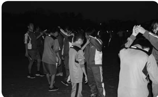
フォークダンスでは、男子・女子仲良く踊っていました。