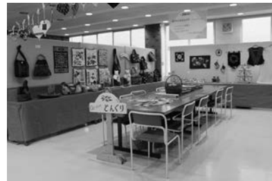
アトリエどんぐり