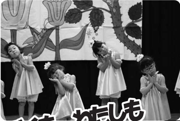
もも組さんの「はなかつパレード」 かわいらしくお花のポーズ！