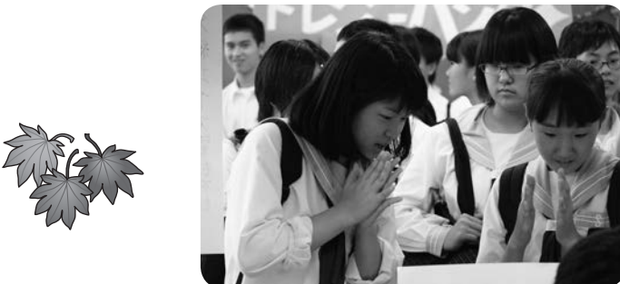
ステージ以外にも、各教室でゲームコーナーや作品展示がありました。