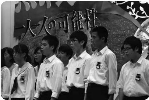
毎年恒例の合唱コンクール

幼稚園、小・中学校においても、学校祭などの学校行事が開催され、「文化の秋・芸術の秋」を堪能しました。子どもたちは、劇や音楽など様々な形で、表現することの楽しさを学びました。中学校学校祭、小学校学校祭、幼稚園おゆうぎ会の様子を紹介します。