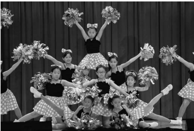
鹿部チアリーディングサークルAnge