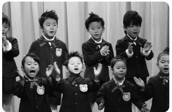
さくら組さんは 歌と合奏も発表しました。