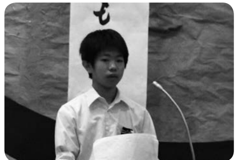
それぞれの思いをぶつけた私の主張コンクール