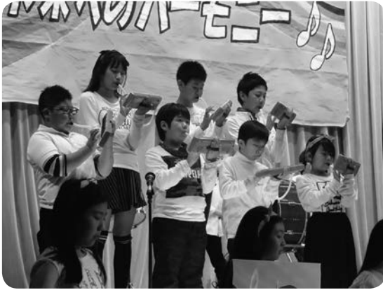
5年生はむずかしい曲を見事に演奏しました！