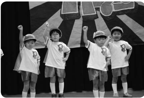
もも組さん男の子は 元気よくパーマンになりきりました。