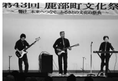
軽音楽サークル 音音