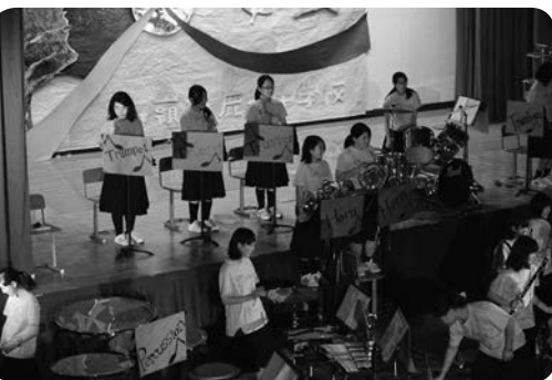
吹奏楽部は練習の成果を披露しました！