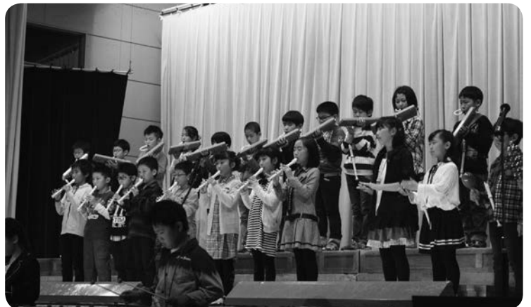
3年生の合奏「茶色のこびん」、 みごとな演奏を披露してくれました♪