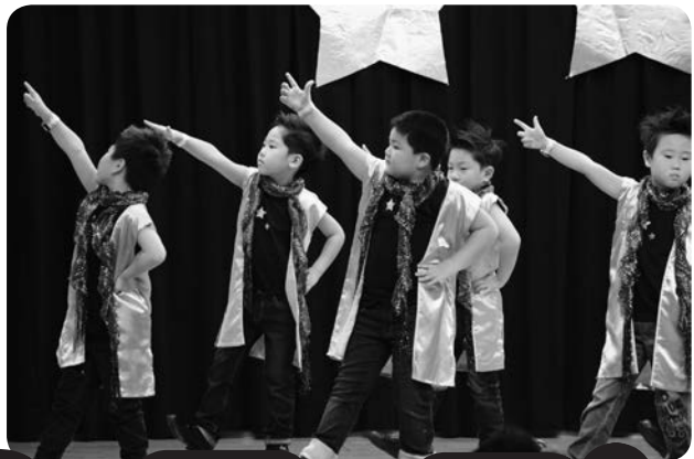
うさぎ組さん男の子による「宙船」 かっこよくキメました☆