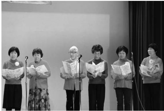
歌声クラブ水平線