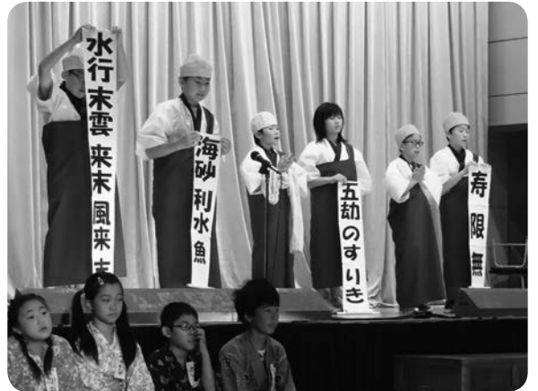
4年生の劇「寿限無」。長い名前もちゃんと言えました。