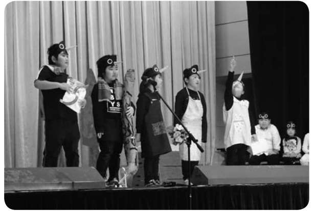
2年生の劇「カラスのパン屋さん」。衣装や小道具もバッチリ☆