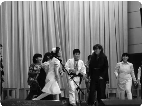
6年生の劇「鹿小同窓会」。 みんなの将来の夢が紹介されました。