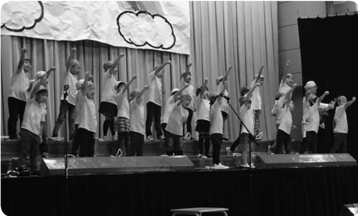
1年生の合唱。元気いっぱいの歌声をとどけました！