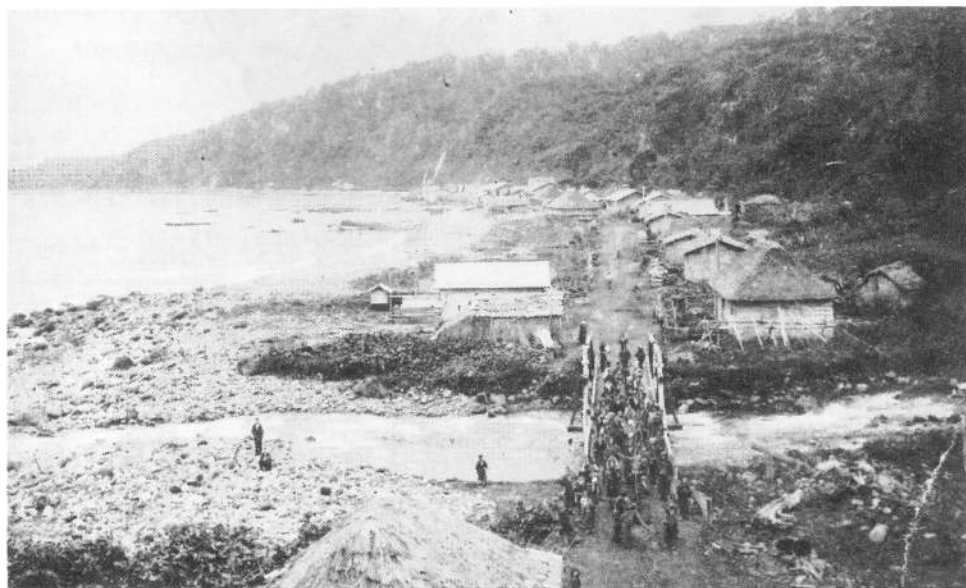
（大正7年 常路川の家並み）

明治・大正の郷土の文書には常路の滝と表記され、三味線滝の名は、昭和一二年前の観光パンフレットに見られ、今では三味線滝が一般名称となっています。