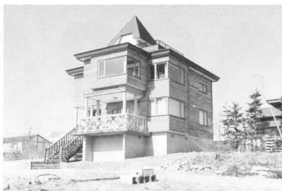
鹿部カントリークラブハウスの前に建てました!!

噴火湾の見える鹿部町で 休養し、海難遺児とのかかわり合い を歌手としてのライフワークのひと つとしたい。