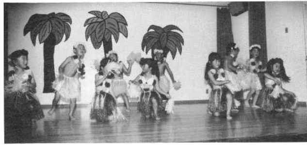
あひる組「ナントカ島の…」

子どもは大きな声で力いっぱい劇や合唱に頑張っていました。 先生方の劇には、子どもや父母から、大きな拍手がありました。 「来年も期待して下さい」…職員一同