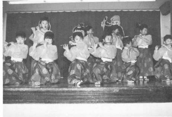
りす組「笛ふき鉄太郎」