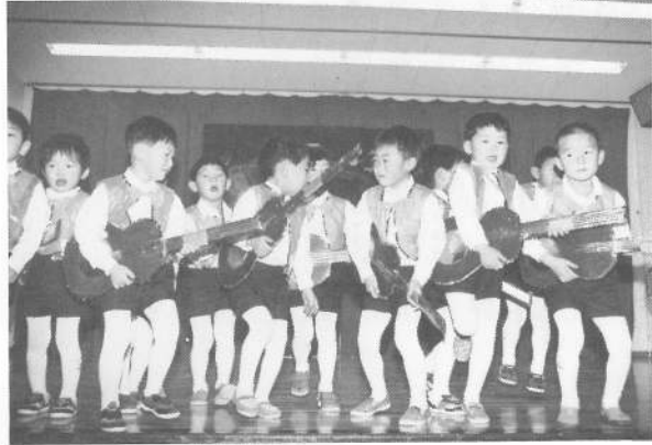
すみれ組「ワニツ子、ロックン・ローラー」