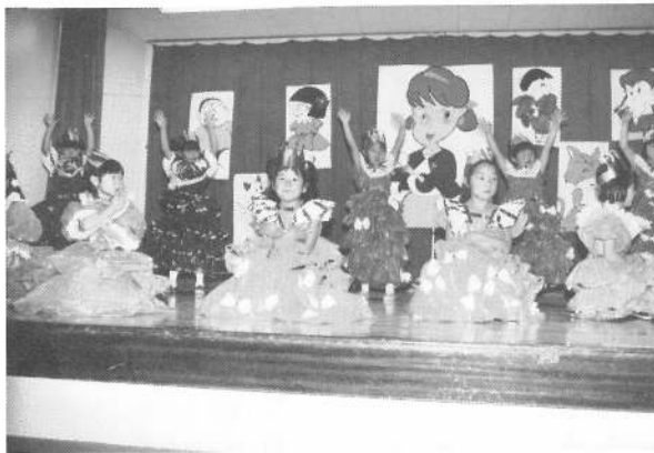
うさぎ組「ひみつのアッコちゃん」