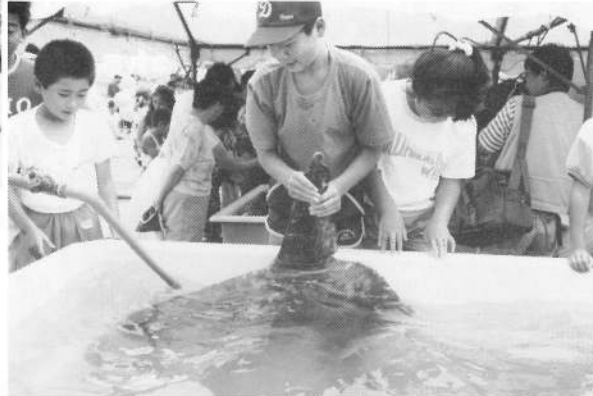
▲ほくマンボーです