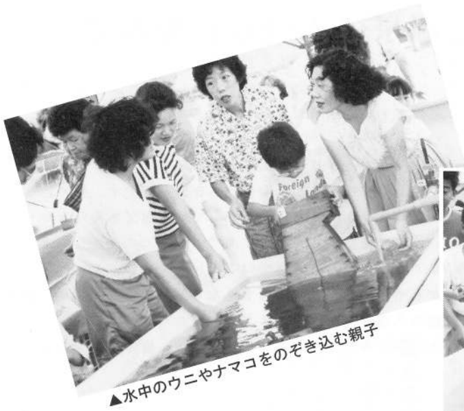
▲水中のウニやナマコをのぞき込む親子