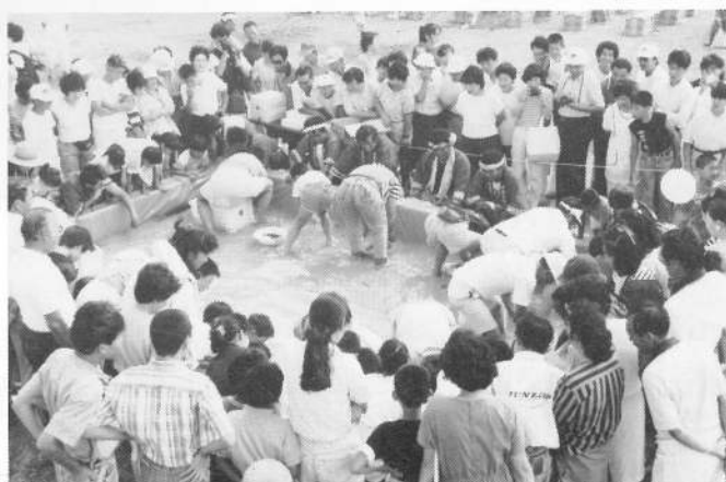
ドジョウ・ウナギのつかみ取り大会▶ いっしょうけんめいでズボンをぬらす 子供も出ました