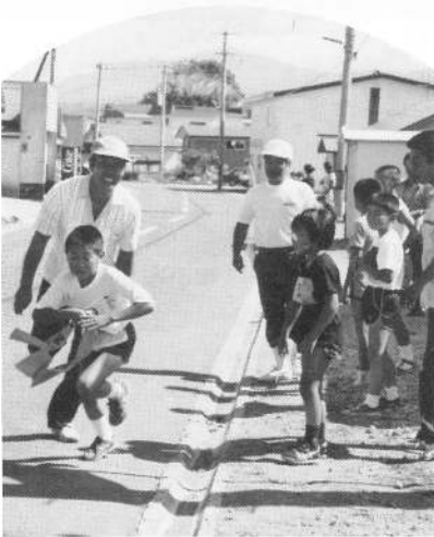
400mでも疲れます ハアハア