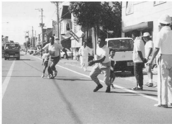
小学校1年生から52歳～54歳へタスキリレー お父さん達の顔も真剣です!!