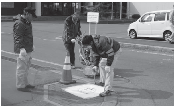
「とまれ」の足跡マークを塗装する 伊藤アスファルト従業員の皆さん

平成28年4月23日(土)、町内の交差点の歩道に、函館市の舗装工事業者「伊藤アスファルト建設株式会社」様が地域貢献の一環で、ボランティアとして平成24年度に塗装した『とまれ』の足跡マークの再塗装を実施しました。 『とまれ』の足跡マークは、子どもたちの安全への願いを込めて塗装されたもので、当町の交通安全に大変寄与するものです。 伊藤アスファルト建設株式会社様、誠にありがとうございました。