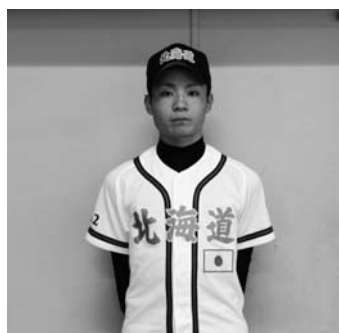
野球で台湾遠征した伊藤くん