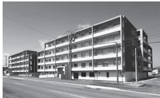
◀ひまわり団地B棟新築工事（完成）▶