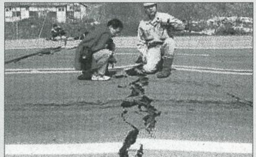
有珠山2000年の噴火前に見つかった国道230号線の亀裂

地殻変動が大きくなると、地割れや隆起として認められるほか、電線のたるみなどによっても確認できる場合があります。