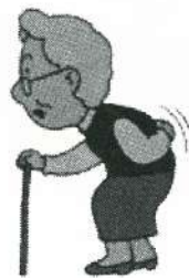
背中や腰が丸くなる