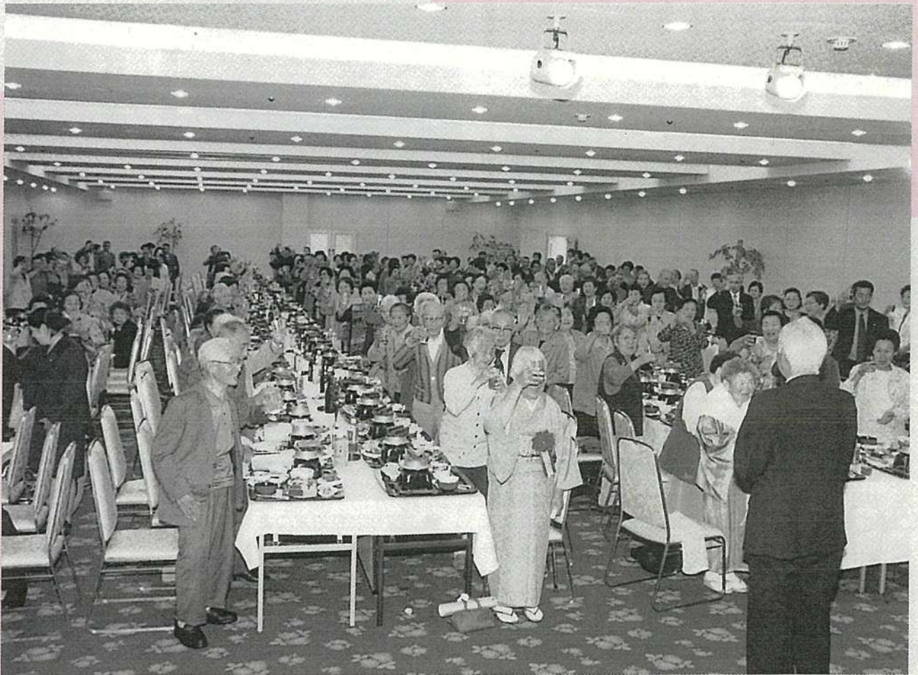
◎米寿祝（大正5年生まれの方）※数え年88歳の方