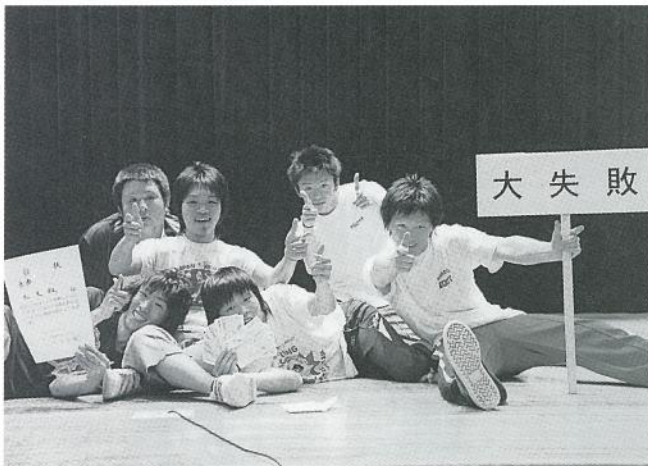
一般の部優勝 大失敗チーム