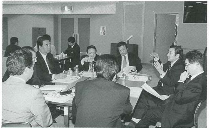
情報交換する両町長と特別職

4月1日に発足した鹿部町と七飯町で構成する「渡島中央部合併問題研究会」において両町長をはじめとする特別職、課長等の初顔合わせとなる第1回合同部会会議が4月30日、鹿部中央公民館において開催されました。研究会では、各課長等で構成する行財政、住民福祉、産業、建設、教育の5部会を設置し、現在、両町が行っている事務事業の洗い出し、内容の調査・検討等、両町の合併に関する諸問題を研究していくこととしております。新市における事務事業においては、各々の町における独自のものや共通のものでも内容細部で違いがあるものがあり、これらの事務事業は共通するものを含め、1,500項目以上あると見込まれております。