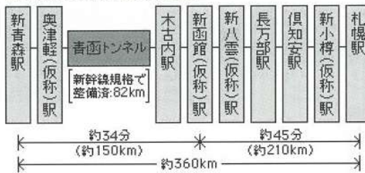
■北海道新幹線設置箇所