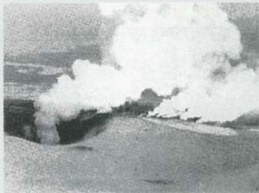
1996年3月5日 北海道駒ヶ岳の噴火 (6日北海道消防防災ヘリコプター撮影)

マグマから分離して地上に蓄えられた水蒸気、あるいはマグマから伝わった熱により火山体内の地下水が加熱され生じた高湿高圧の水蒸気によって起こる爆発的な噴火です。噴出物は古い火山体の岩石に限られ、マグマ物質が含まれていないことが特徴です。頻度としては小規模な噴火が多いですが、1888年の磐梯山噴火のように、火山体が崩壊して大きな災害となる場合もあります。北海道駒ヶ岳の1996年以降の噴火や雄阿寒岳の1955年以降の噴火はすべて水蒸気爆発です。