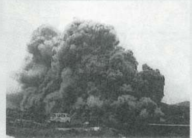
2000年3月31日 有珠山の噴火

最近の例として2000年有珠山噴火のうち、3月31日の最初の噴火はマグマ水蒸気爆発でしたが、その後は水蒸気爆発に移行しました。また、1983年の三宅島噴火では粘性の低いマグマが噴水のように吹き上げる活動から、海岸付近では激しいマグマ水蒸気爆発を引き起こしました。