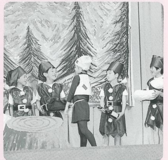
▲「金のガチョウ」(劇)〔2年生〕