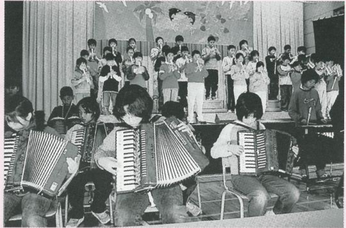
▲「亜麻色の髪の乙女」他(音楽)〔5年生〕