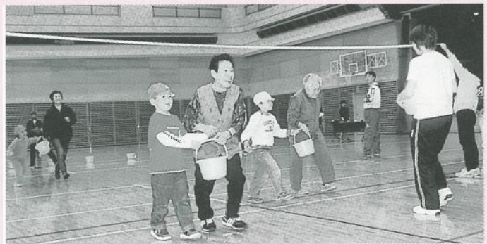
好きなくだものは何?