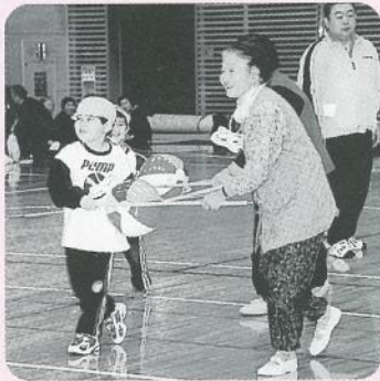
なかよく遊ぼうね!