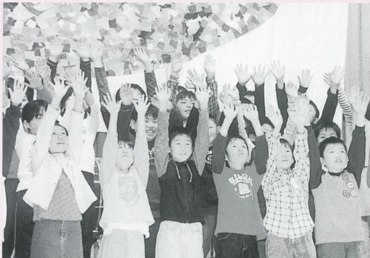
▲「うたえバンバン」他(音楽)〔3年生〕