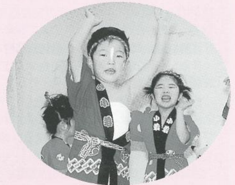
「お祭りなにわ節」(お遊ぎ) [年少組]