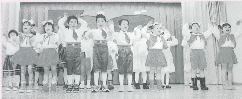
「長靴をはいたネコ」(劇) [年長組]