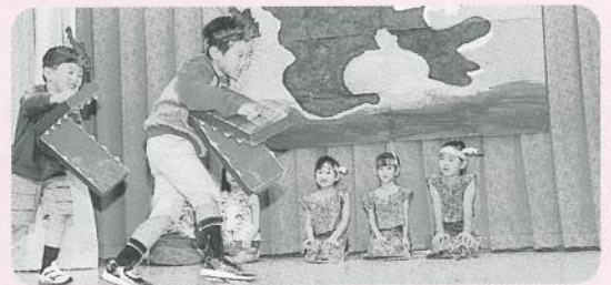
「ピーターパン」(劇) [年長組]