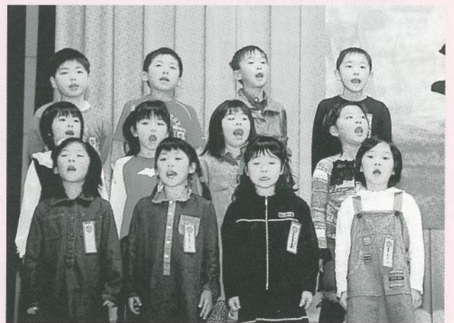
▲「にんげんっていいな」他(歌)〔1年生〕