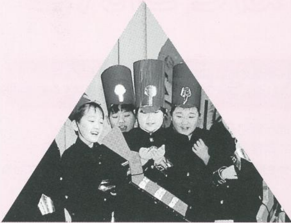
▲「ぞうさんのたまごやき」(劇)〔4年生〕