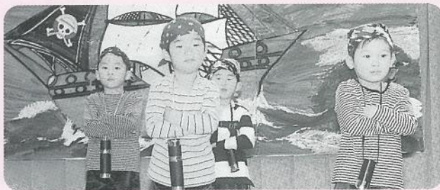
「海賊無人島」(お遊ぎ) [年少組]