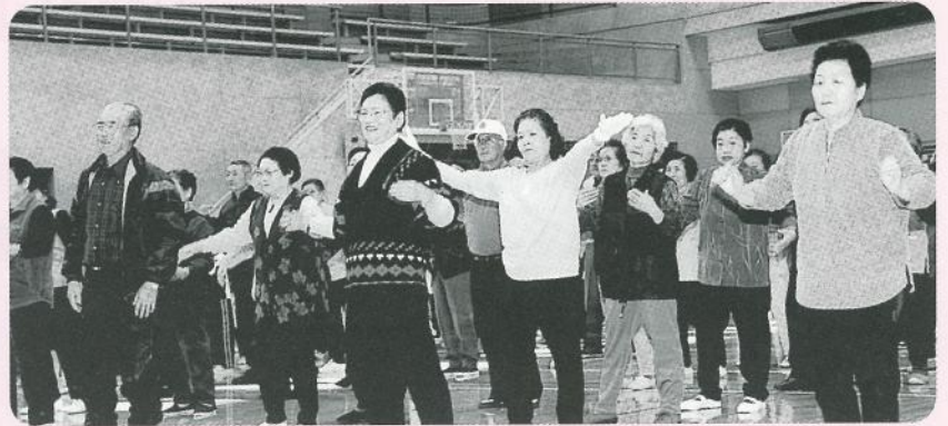
みんなで準備体操