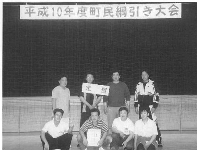
平成10年度町民綱引き大会