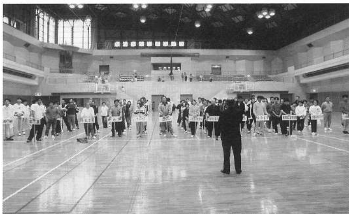
参加チームによる開会式