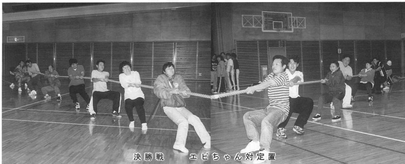
決勝戦 エビちゃん対定置