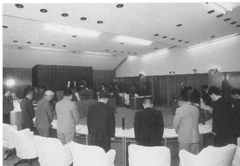
参列者による黙祷