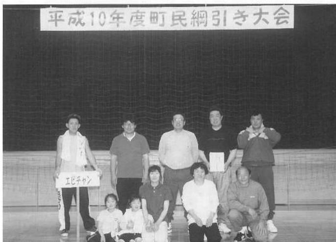
平成10年度町民綱引き大会