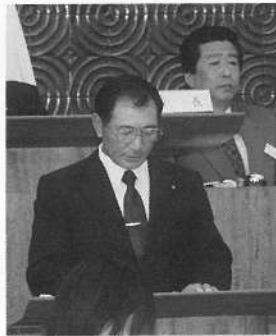
追悼の辞—千葉副議長

を有し、昭和四十四年の二月鹿部村議会議員に初当選され、以来、数々の要職を歴任しながら、連続八期二十九余の長きにわたり鹿部町の振興発展にその生涯を捧げてこられました。 願わくば永遠に安らかにお眠りくださいまして、心から哀悼の言葉といたします。」と述べられました。 心からご冥福をお祈り申し上げます。