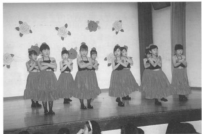
船のリンドバット&蝶のフラメンコ (りす組)