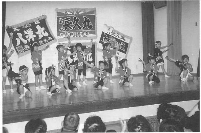
あっぱれそんごくう&よさこいソーラン (あひる組)