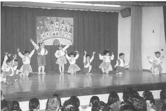
どんぐりマンボ&ロックンお菓子 (さくら組)