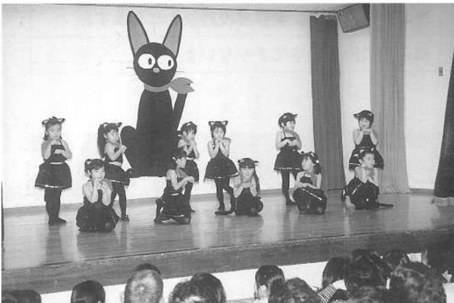
キャッツパーティー&さかな特急便 (すみれ組)