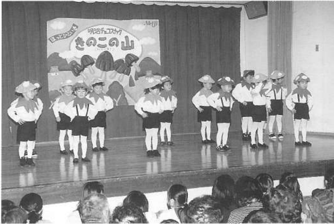
キノコホリデー&小さなショーガール (たんぼぼ組)