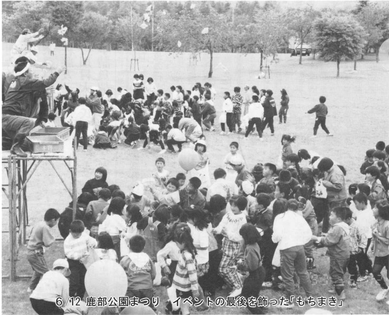
6/12 鹿部公園まつり イベントの最後を飾った「もちまき」