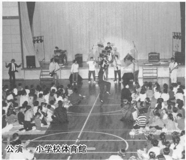
公演「小学校体育館」