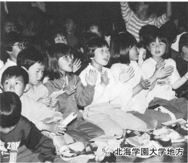
北海学園大学地方