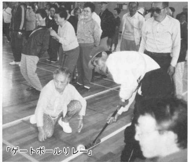
「ゲートボールリレー」