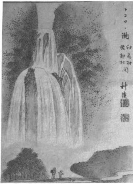
北海道漁業図絵 トコロの滝 明治12年

亀田・戸井・恵山からはアイヌの小舟に送られて鹿部に来たのは旧暦五月二十九日でした。今の暦で六月二十九日でした。