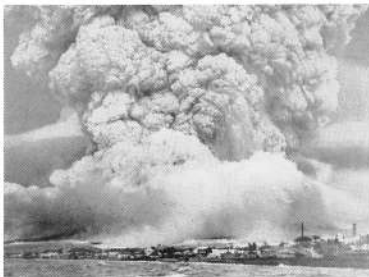
大噴火後の駒ヶ岳 (絵葉書)

鷺木之潟鹿部原 石川行尽落森村 空灘杳渺連天処 砂浦峯頭月一痕 (鷺ノ木浜から鹿部村へ行軍の途中、石川を行き尽きると森村がある。空と海が一つに連なる所に駒ヶ岳の剣ヶ峯に半月を見る)