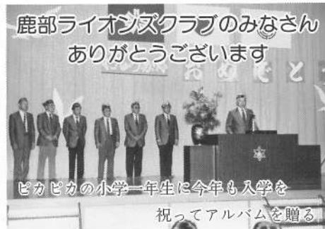
鹿部ライオンズクラブのみなさん ありがとうございます

四月十一日、お母さん、おばあちゃんに手をひかれ、4歳児が、79名入園しました。 不安がいっぱいの子ども達も、大きい組のお姉さん達のおゆうぎには、シーンとして見ていました。