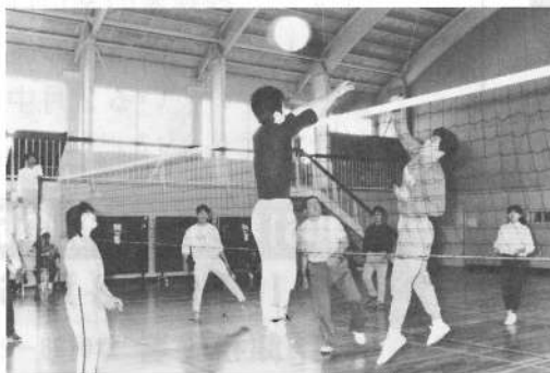
スポーツ大会に参加しましょう