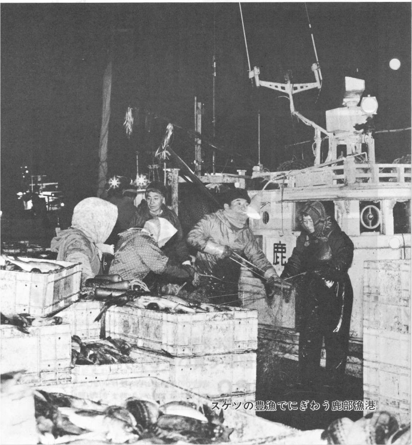
スケツの豊漁でにぎわう鹿部漁港