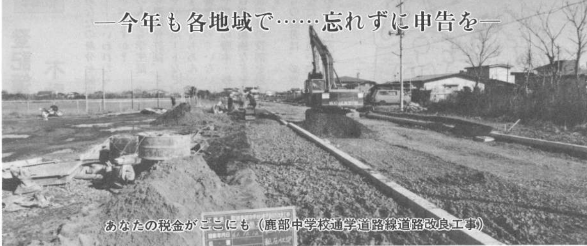
あなたの税金がここにも (鹿部中学校通学道路線道路改良工事)