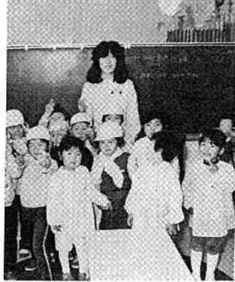
◎昭和五十八年三月函館大谷女子短期大学を卒業。 四月しかべ幼稚園に勤務 ◎職場について しかべ幼稚園に勤務し、年少た

◎今後の鹿部村について いよいよ鹿部も「町」になると聞いていますが、なるんだったら早い方がいいと思います。早く町になり、今まで以上に活気に満ちたマチになってもらいたいと思います。 ◎職場について 勤務する川村産業は、父の経営