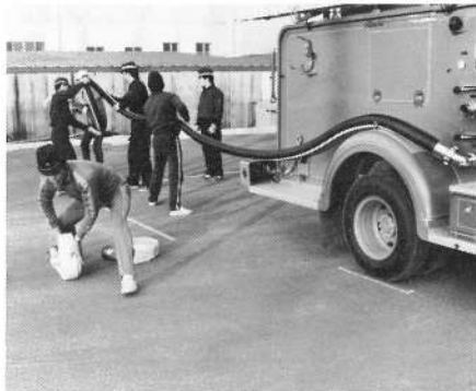
練習に励む団員チーム

この大会は各市町村持ちまわりで開催しており、渡島管内消防関係者や参観部隊、一般参観者など約一、〇〇〇名くらいの人達が集まる予定です。当日は漁港前を午前八時に出発し、中学校バスバウンドも参加しての街頭行進を行い約二・四キロメートルを行進し、大会場に向います。当日は沿道に沢山の方々を拍手で歓迎し、大会場ではおのの声を援をいただけますようお願いいたします。