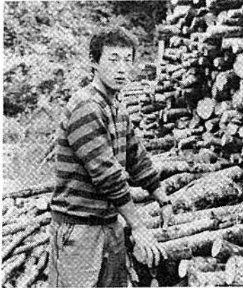
◎昭和五十六年十一月大野農業高校を中退し、有限会社川村産業に勤務 ◎職場について 勤務する川村産業は、父の経営