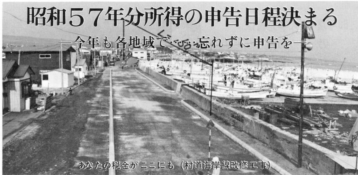
あなたの税金がここにも（村道海岸線改修工事）