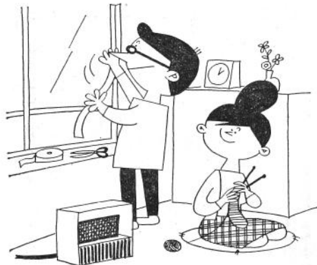
外へ熱を逃がさない、押入などに水滴がつかないなどの工夫がたいせつ