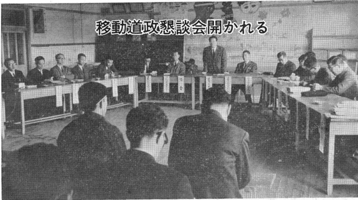
移動道政懇談会開かれる

渡島支庁主催による移動道政懇談会が十一月二十四日午後一時三十分から公民館に於て開かれましたが、好天気に恵れ出漁者が多く集りが悪かったが、熱心な質疑が展開された。 まず能登渡島支庁長から「交通事情、通路の改良……知事に手紙を出す運動等を通じて道民との距離が非常に短くなってきたが移動相談によって住民の声をじかにきいて謙虚に反省し、鏡に写してあやまりのない様に実施したい」と主旨の説明があり棟方村長を司会者として「管内の管公庁の主脳部が集つての道政懇談会であるが集りが悪くて誠に申し訳ない。今回の内容は広報で全村に知らせたい」と挨拶。 主たる内容は次のとおり 質 冬期オリンピックが札幌で開催され、模大な予算がかかり部部にそのしわよせがくるのではないかと…… 答 国際的なものなので施設、選手宿舎等に費用がかかる札幌中心である。道知事は四十二年予算からはオリンピック経費は別枠でと要請しているがまだはつきりしていない。青年に於ては千載一遇のチャンスである。 質 大沼道路の改良されるのは結構だが巾がせまくなつて徐行している 答 将来はトンネルから大沼駅までのような道路になる。一キロ七百万円から一千万円かかる。二米の拡幅をやる予定で来年からは舗装を前提とした工事になる。 質 森高の校舎の修繕費がPTAで計算に組まれて、道で負担すべきな道立高校は、道で負担すべきな 答 砂原からの海岸道路について、完全舗装が二つの踏切をなくし四十四年に漁港と本別が一種漁港の内示があつた。 質 古部と本別が一種漁港の内示があつた。 その外、家畜市場も農協を通じて設置されることも出来る。 更だ出生資金等も三十万円まで借りること出来、青少年の非行問題、し尿処理、献血推進協議会の発足、要望など午後四時散会しました。