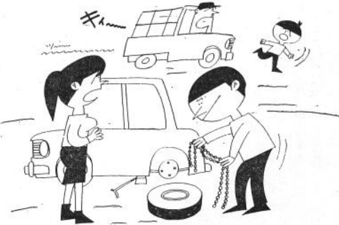
すべり止め装置は完全に