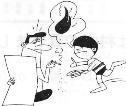
火事で死ぬ人がふえています 大事の前に小さい注意を

ことしも又ストーブ等の暖房器具を使用する時期になりました。火災発生の原因は、火の不しまつや、不注意によるものです。最近における火災の状況は、火災の発生件数は少なくなっておりますが、反面死傷者をとまなう火災も少なくありません。