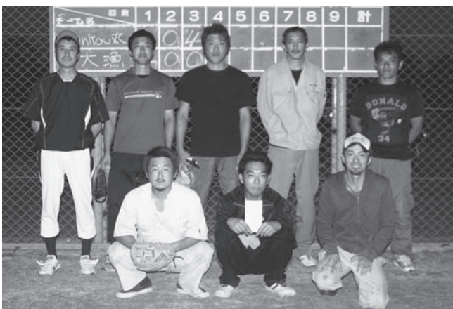
【優 勝】 大漁パワーズ 【準優勝】 J y u n k o u 丸 (漁研)

8月26日(火)から、山村広場野球場において町民ソフトボール大会が開催され、9チーム約100名が参加し、熱戦が繰り広げられました。各チーム随所に好プレーを見せ、決勝戦では4対4の同点のまま最終回までもつれ、手に汗握る熱戦となりましたが、前評判通りの強さで見事大漁パワーズが優勝しました。成績は次のとおりです。