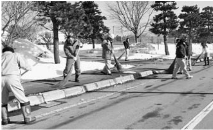
中学校周辺の歩道を清掃する 伊藤アスファルト(株)従業員の皆さん

3月23日(日)、幼稚園、小学校、中学校周辺の清掃作業が行われました。この作業は、函館市内の舗装業者、伊藤アスファルト建設(株)が地域貢献の一環で、ボランティアとして実施したもので、学校施設周辺の歩道などを清掃していただきました。園児、児童生徒の通園通学時における安全な環境づくりに大変寄与するものです。伊藤アスファルト建設(株)様、誠にありがとうございました。