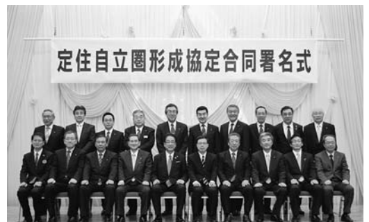
定住自立圏形成協定合同署名式

一定の都市機能や人口を満たす中心市と周辺の市町村が定住自立圏形成協定を結び、圏域全体で生活に必要な機能を確保する制度です。