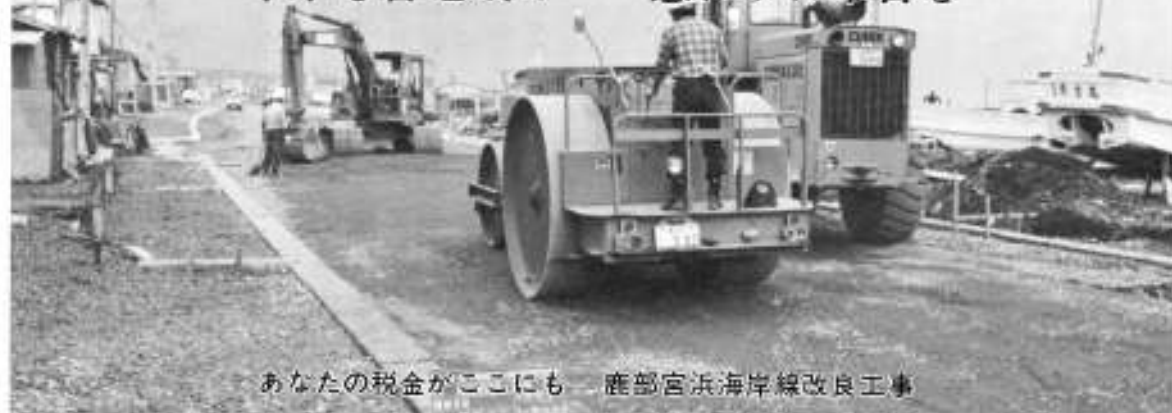
あなたの税金がここにも 鹿部宮浜海岸線改良工事