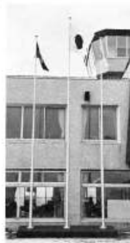
役場庁舎前 国旗掲揚塔

○ 一月十八日、鹿部カラオケ愛好会より、同会主催の「鶴五郎チャリティ歌謡ショー」の資金の一部