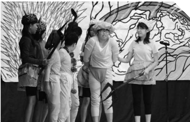
6年生の劇「じごくのそうべえ」。 本格的な劇で観客を引きつけました。