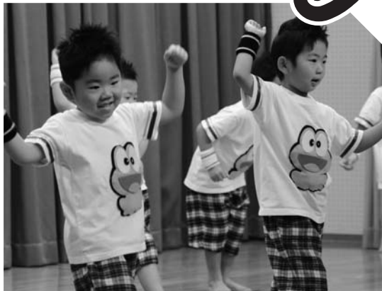
もも組さんの「ど根性ガエル」。 元気いっぱい踊りました！