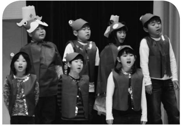
衣装もバッチリ♪ 2年生の劇「かえるの王さま」。

10月25日(金)には、鹿部小学校が学芸会を開催しました。 今年度は「ニコ・キビ・ハキでやりとげよう! みんなでつくる最高のステージ」をスローガンとし、劇や合唱、器楽合奏を発表しました。 1・3・5年生は合唱と器楽合奏を行い、息の合ったメロディーを奏でました。 2・4・6年生は、一生懸命練習した劇を披露しました。また、中学生による合唱の発表も行われました。 校内では、児童がこれまでに制作した工作や絵画を展示する作品展も同時開催され、来場された皆さんの目を引き付けていました。