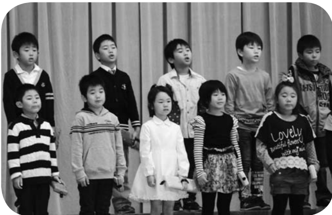
1年生の合唱。元気いっぱいの歌声をとどけました!