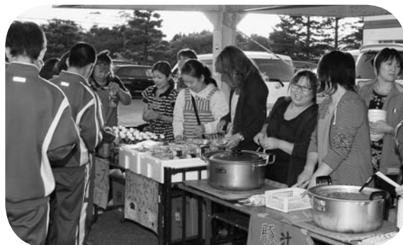
父や地域の皆さんにもご協力をいただきました。