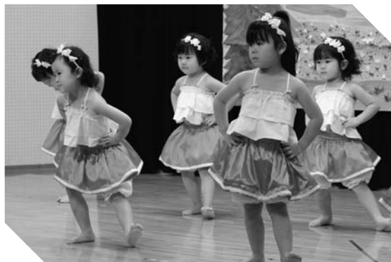
もも組さんの「アルプスの少女ハイジ」。 一生懸命練習しました。