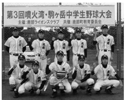
優勝した鹿部中学校野球部の皆さん