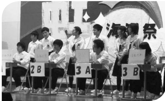
学級対抗のクイズ大会も行われました。