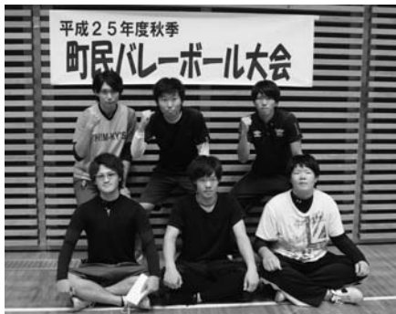
優勝した「新濱会」の皆さん