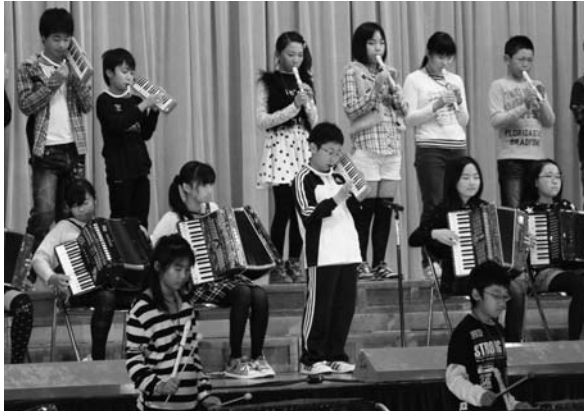
5年生は息のあった器楽合奏で会場を盛り上げました。