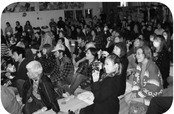
今年は例年よりもたくさんの方に ご来場いただきました。