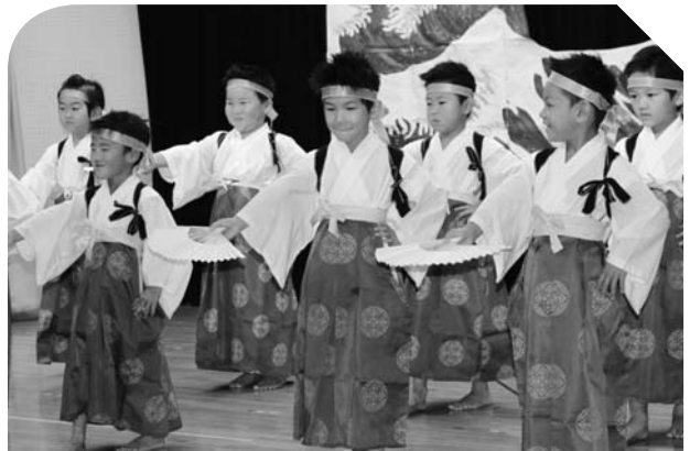
うさぎ組さんの「風の古城」。 かっこよくキメました☆