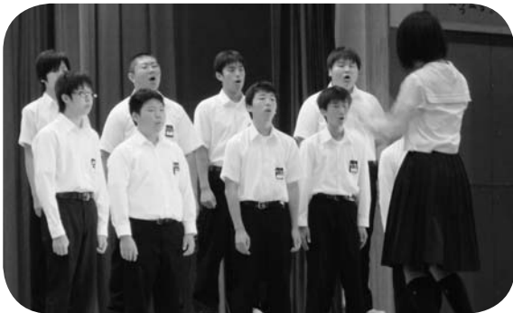
恒例の合唱コンクール。最優秀賞は3年B組。

幼稚園、小・中学校においても、学校祭などの学校行事を開催し、「文化の秋・芸術の秋」を堪能しました。子どもたちは、劇や音楽などさまざまな形で、表現することの楽しさを学びました。 中学校学校祭、小学校学校会、幼稚園おゆうぎ会の様子を紹介します。