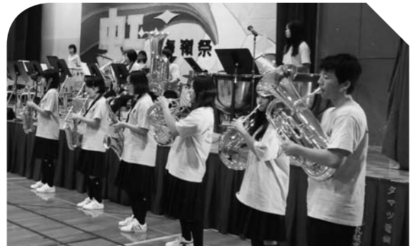
吹奏楽部の演奏が会場を盛り上げました!!