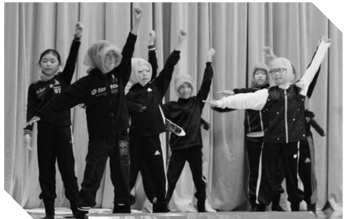
4年生の劇「からくりになんじゃやしき」。ダンスも披露☆