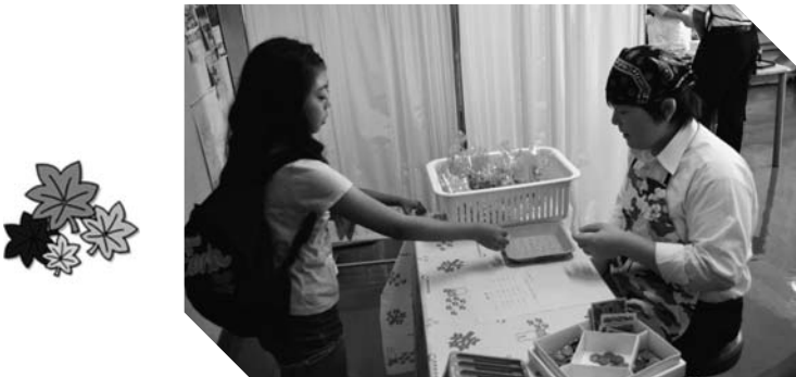
食品販売では生徒が大活躍しました☆