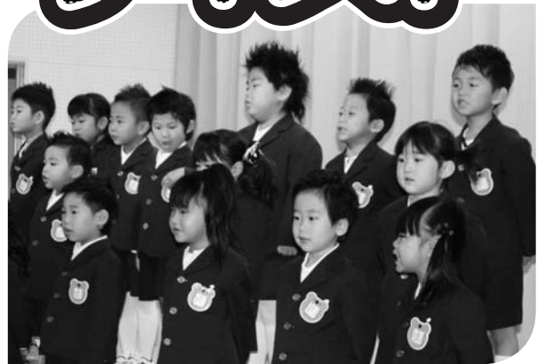
さくら組さんは 歌と合奏も発表しました♪