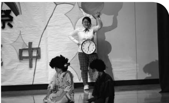
実行委員会が演劇などを企画しました。