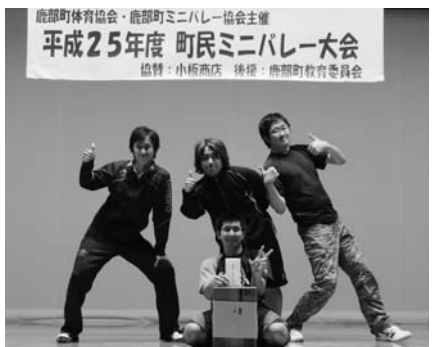
優勝した「アジアの大砲」の皆さん