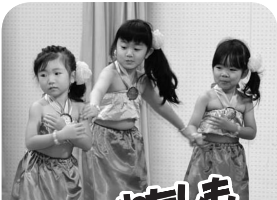
さくら組さんの「アンダーザシー」。 人魚姫を演じました。