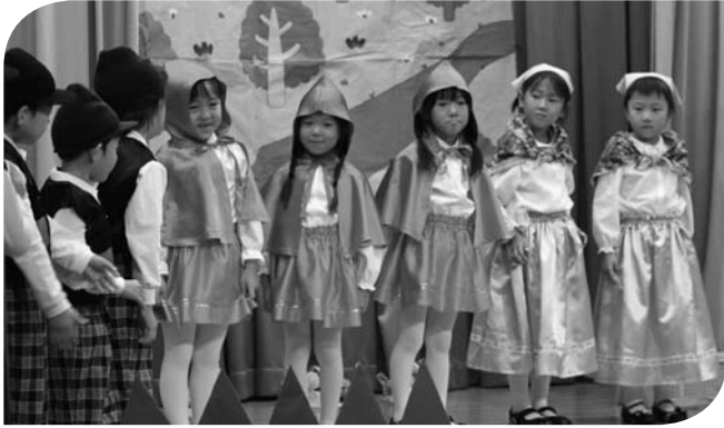
うさぎ組さんは劇「あかずきんちゃん」を好演しました。

園児たちの元気な歌や劇、器楽合奏などは、来場された皆さんを魅了し、笑顔にっていました。