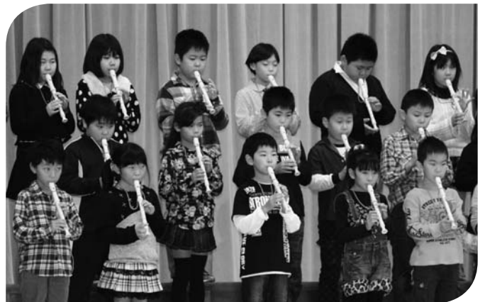
3年生の合唱「うさぎ」。 始めたばかりのリコーダーにも挑戦しました。