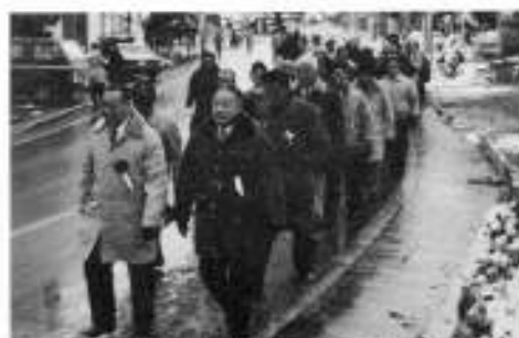
町長・議長を先頭に来賓多数も参加