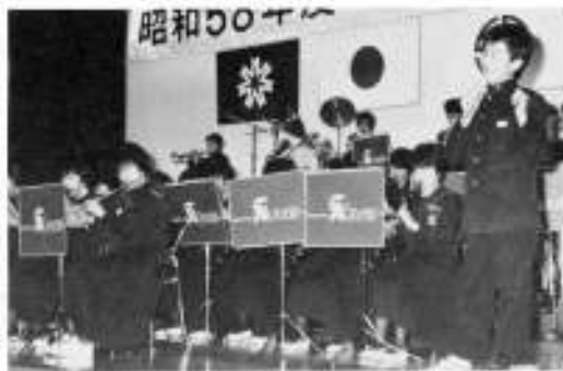
鹿部町文化祭 鹿部のマツチです。 吹奏楽部の演奏をバックに歌いました。 (11月3日撮影)