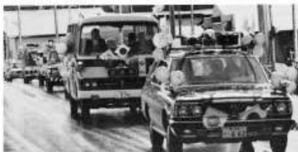
車によるパレード