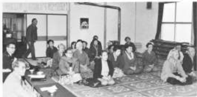
みんな真剣に勉強しました。