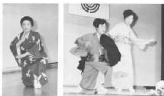
藤間会による舞踊