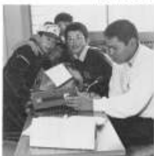
茅部ハムクラブのアマチュア無縁