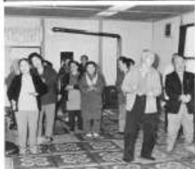
楽しい体操をしました。