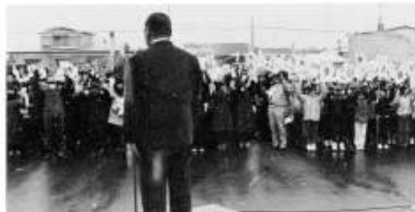
船橋町議会議長の音頭で万才三喝