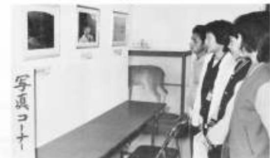
大人気の写真コーナー