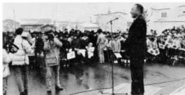
川村町長のあいさつ

漁旗が飾られパレードを盛り上げました。パレード終了後、役場前の広場で祝賀集会が開かれ、川村町長が、「きょうの町制施行の基礎を築いた先人の努力に感謝し、これから町民全員が協力して住みよいまちづくりを進めよう」と挨拶しました。次いで、船橋町議会議長の音頭で万才三喝をし、この祝賀行事をしめくりました。パレードに参加した児童、生徒へは、紅白のまんじゅうが配られ、子供たちは大喜びでした。なお、この行事を取材するためのテレビ、新聞の各社が来町して取材をしていました。