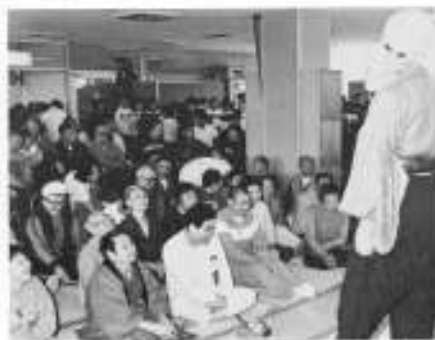
江差の繁次郎つて 本当に面白いね。 鹿部小学校六年生がリハビリを奨励しましたが、劇「江差の繁次郎」では大爆笑でした。