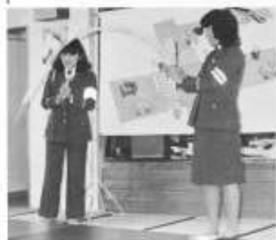
さては南京玉すだれ