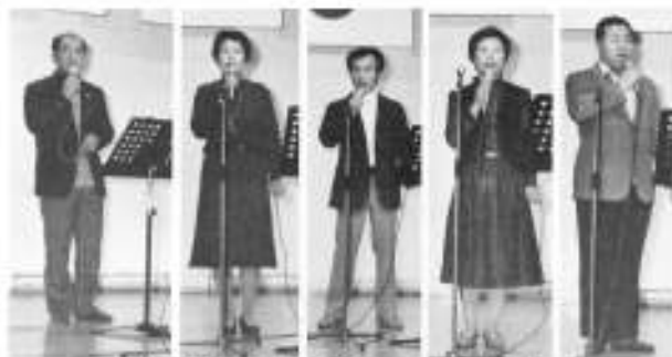
演歌カラオケ愛好会のみなさんの歌