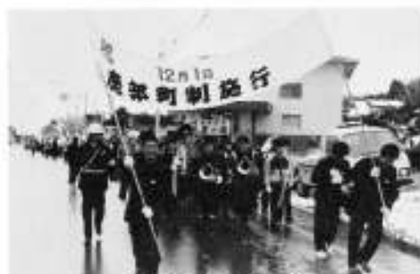
横断幕を先頭にして