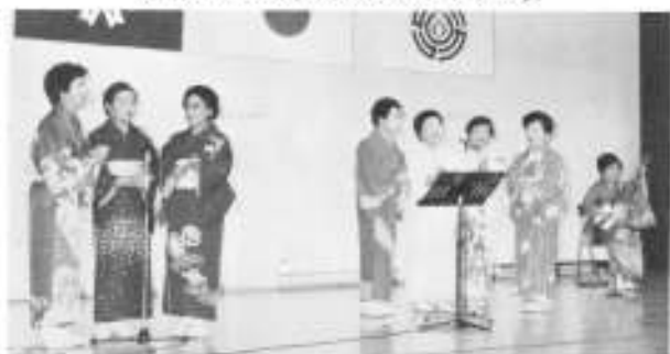
民謡愛好会のみなさんの民謡