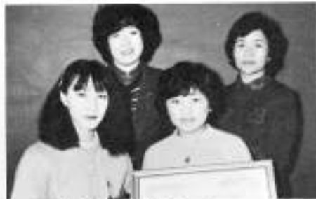
教職員鹿部卓球チーム