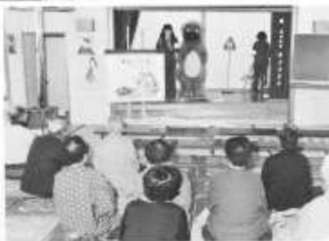
老人学級 交通安全教室開催 老人学級では、交通安全を課題として、十一月二十九日老人いこの家で交通安全教室を開催しました。当日は、函館中支署から婦人警官が、来町し、ぬいぐるみ等の用具を使って、楽しく交通安全の学習を教えてくださいました。