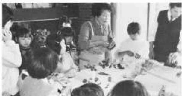
ドライフラワー講習会