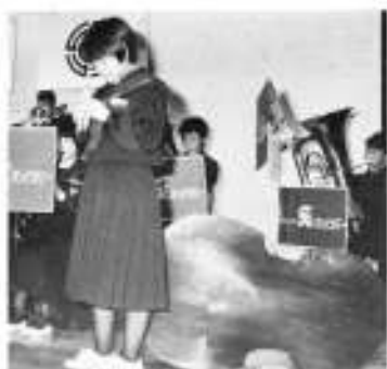
カンニングペーパーを見ながら歌いましたが、あーあ、はずかしかったナ。