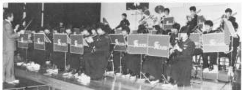
鹿部中学校吹奏楽部の演奏