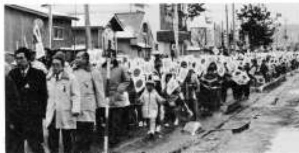
日の丸と町章の小旗をもつてのパレード