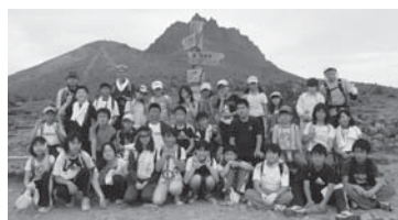
馬ノ背で記念写真を撮る5年生の皆さん