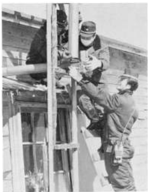
独居老人への奉仕作業