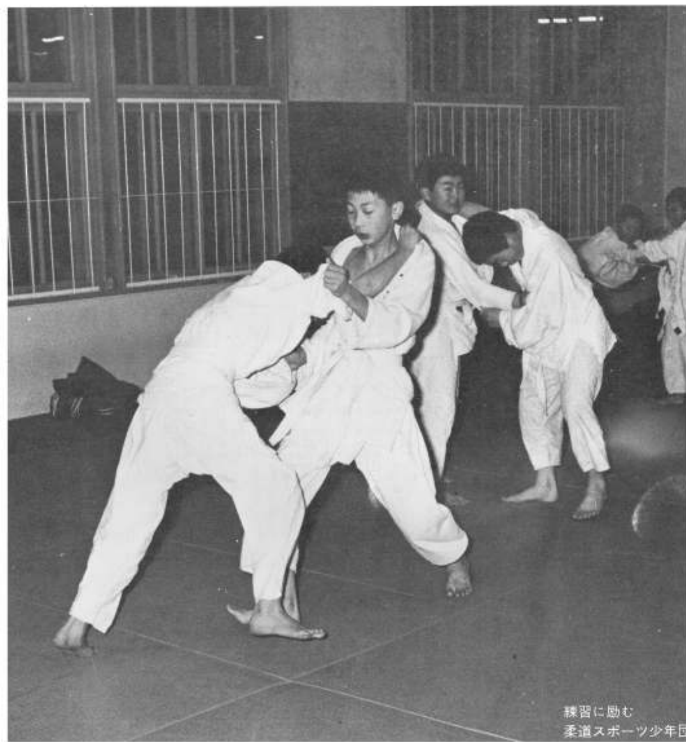
練習に励む 柔道スポーツ少年団