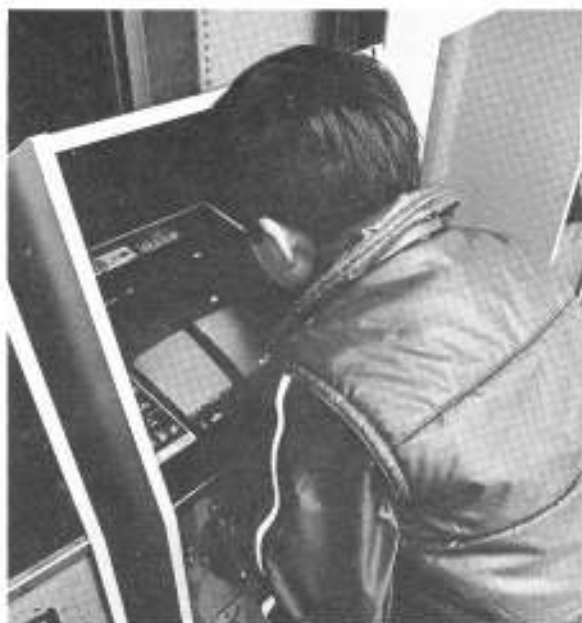
非行の芽は早いうちに摘み取るように

非行の種類で最も多いのは窃盗。単純な動機で万引きをしたり、自転車などを盗む、いわゆる、遊び型非行、が依然として目立っています。また、これまで年々減っていた粗暴犯、知能犯が増加に転じているのも新たな傾向で、校内暴力事件の増加はその表れの一つです。