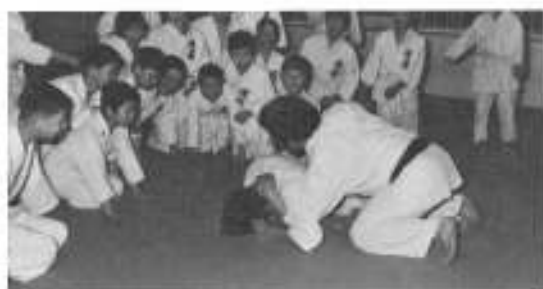
稽古の指導を受ける団員

今後、ますますの活躍が期待される鹿部柔道スポーツ少年団 ガンバレ柔道スポーツ少年団 チビッコ三四郎