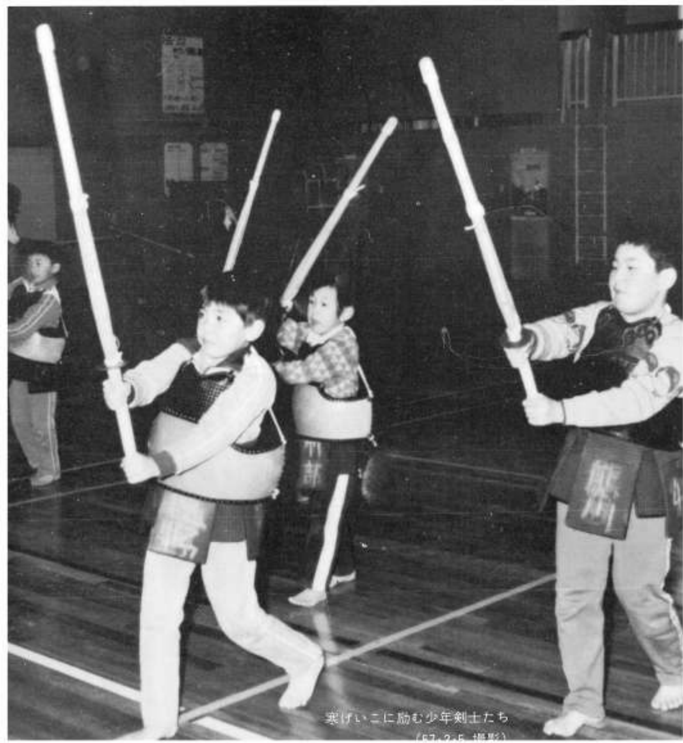
爽げいに励む少年剣士たち