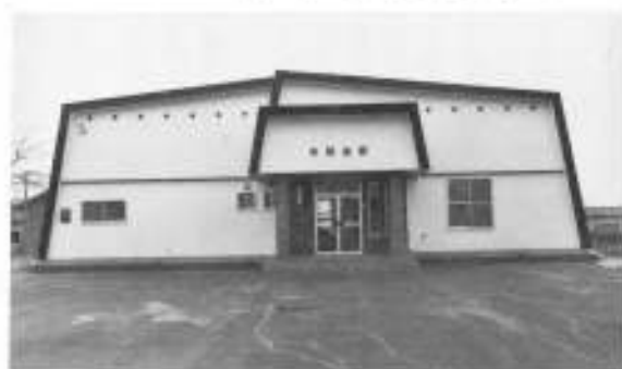
あなたの税金がここにも(本別会館)