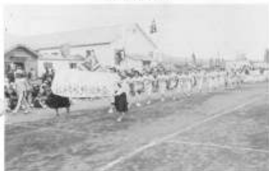
13、14、15町内会 全道制覇選手のお母さん達