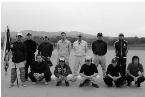
二年連続優勝のオーシャンズ

5月21日(月)から、山村広場野球場において、「鹿部町旗争奪野球大会」が開催され、5チームが参加し熱戦が繰り広げられました。 大会では各チームが抜群のチームワークで好プレーを連発し、白熱した試合となりました。 成績は次のとおりです。 【成績】 優勝 オーシャンズ 準優勝 大漁パワーズ