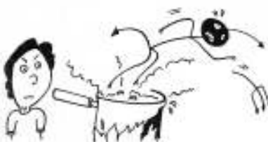
食中毒シーズンです。食品の管理に万全を

ガの粉などが目に入ったときは、ぬるま湯でよく洗い、冷湿布しておきます。充血がひどいときは、専門医に診てもらいましょう。