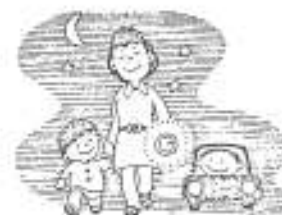
見ている歩行者から歩行者が自動車が歩行者が見えないことあり

○歩行者及び自転車利用者の薄暮から夜間における事故防止を図るため、「夜光反射材」の着用を推進しよう。