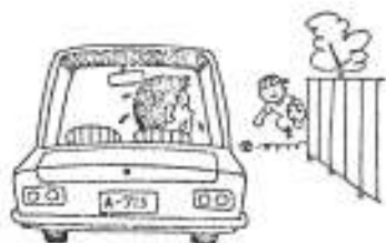
減速、一時停止。見つけたら必ず減速、一時停止。