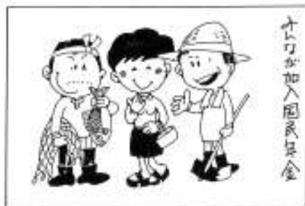
子どもが加入国民年金

免除を受けた場合、その免除された期間も計算の中に入りますが、老齢年金の額は、保険料を納めた場合の三分の一に減額されます。なお、保険料を免除された方で、その後生活に余裕ができ、将来高額の年金を受けたいと望まれる方は、免除を受けてから十年以内であれば、さかのぼって基本保険料を納めることができます。