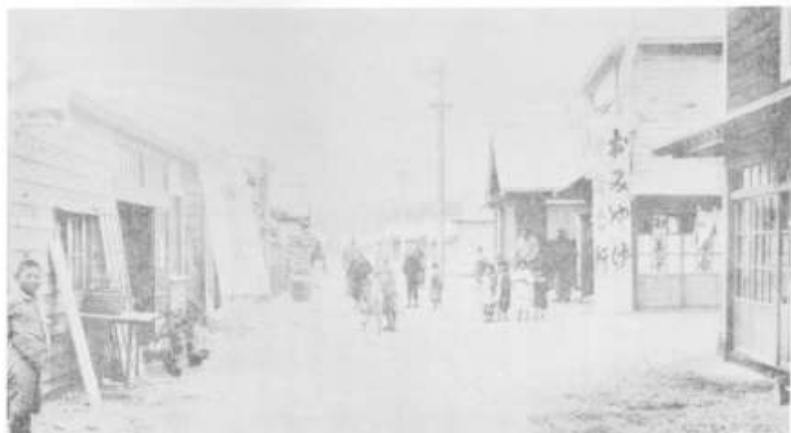
昭和初期の鹿部温泉市街の一部