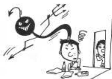
みんなの力でシンナー遊びを退治しよう

「死を招くシンナー乱用 みんなで一掃」 シンナー等の乱用事案が、ここ数年急増し、少年の非行の特徴として大きな社会問題となつていまい。恐ろしいシンナー遊びを退治し、少年を健やかに育てましょう。