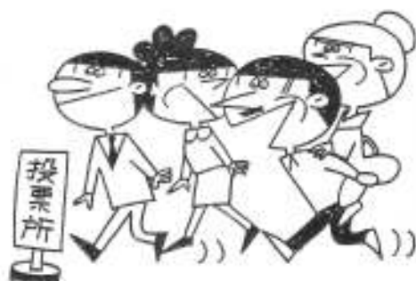
投票日 …この日は雨がふっても雪がふっても…