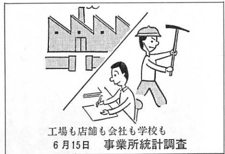
工場も店舗も会社も学校も 6月15日 事業所統計調査